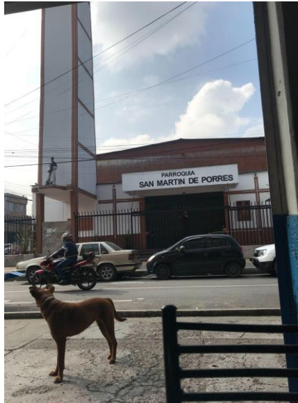
(archivo fotográfico, 21 de diciembre de 2021, fotografía de la parroquia tomada desde una de las cafeterías mencionadas)

San Martín de Porres es fácil, basta con llegar a la estación de Transmilenio 27 “movistar arena” y caminar alrededor de 5 minutos. La primera impresión que me dejó hacer este recorrido fue que la parroquia desentona en la cuadra en la que está. A lo largo de esa calle hay, casi que únicamente, negocios y talleres relacionados con repuestos vehiculares y vehículos (véase concesionarios, talleres mecánicos, y distribuidores de repuestos). La excepción a esto son la parroquia, su respectiva casa parroquial y dos cafeterías.