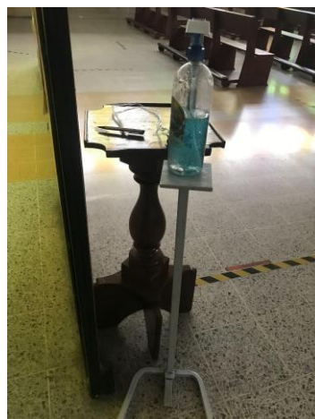
(archivo fotográfico, 11 de febrero de 2022, fotografía del dispensador de gel desinfectante de la parroquia)

Es en este protocolo publicado que encontramos indicios de otras modificaciones espaciales. Al igual que en muchos otros espacios como conjuntos residenciales, la toma de temperatura (y por ende la presencia de personal y termómetro) existió como medida en la parroquia para garantizar que ningún posible contagiado ingresará a la parroquia. Y es que otros elementos como la desinfección de calzado a través de un tapete y el uso permanente del tapabocas, que todos (religiosos o no), conocimos y vivimos hacen acto de presencia también en la parroquia.