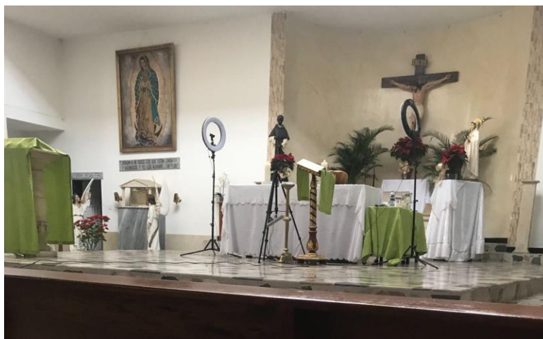
(archivo fotográfico, 11 de febrero de 2022, fotografía del podio desde donde se dan las eucaristías en la parroquia)