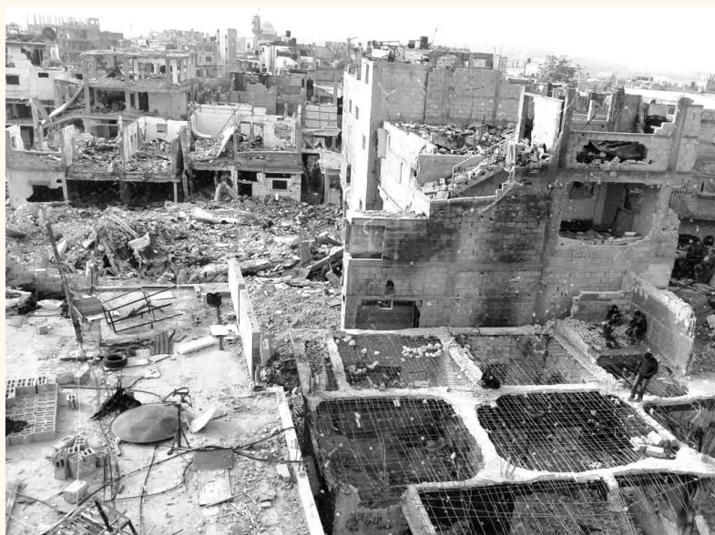
Fotografía tomada por Valeria Cortes en la Franja de Gaza

Hacia el siglo XIX, cuando comenzaron a emerger movimientos nacionalistas entre judíos y árabes en la región de Palestina (en este momento parte del imperio Otomano), el sionismo, un movimiento judío que abogaba por la creación de un Estado judío, ganó fuerza en la primera mitad del siglo XX. Tras la Primera Guerra Mundial, el Mandato Británico sobre Palestina, había otorgado a Gran Bretaña y control absoluto de la región y la inmigración judía aumentó considerablemente.