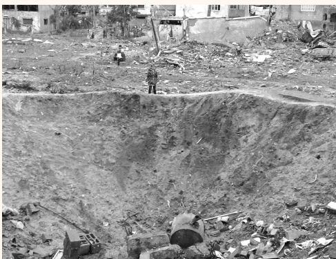
Fotografía tomada por Valeria Cortes en la Franja de Gaza

En su análisis por los medios, Valeria ha visto cómo a los palestinos los llegan a "matar" hasta tres veces. En esta va primero cuando los asesinan físicamente, luego cuando los matan luego de negarles la justicia y por último cuando los calumnian en los relatos contados hacia el mundo, en los que igualan a la víctima con el victimario, "esto no es un conflicto, es una ocupación" Cortes.