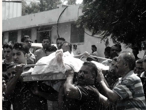
en la Franja de Gaza

Desde este ataque, miles de civiles han muerto y muchos más se encuentran en estado crítico debido a los bombardeos constantes y al bloqueo completo que decretó Israel, en donde mucha de la ayuda humanitaria se ha quedado en las fronteras de la Franja de Gaza. En esta ayuda se encuentran camiones con medicinas, alimentos, combustible y muchos productos indispensables para la supervivencia de este pueblo. También los hospitales, según la ONU, se encuentran al "borde del colapso", esto debido a la falta de agua y electricidad, este último causado por la falta de combustible, según el Organismo de Obras Públicas y Socorro de las Naciones Unidas para los Refugiados de Palestina en el Cercano Oriente (UNRWA), y a los bombardeos y ataques de parte de Israel que han causado que sea cada día más difícil atender a los heridos.