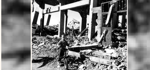
en la Franja de Gaza

Tras la investigación y opiniones de algunos periodistas expuestas y no expuestas en este documento, concluimos que existen los siguientes factores desde el análisis: