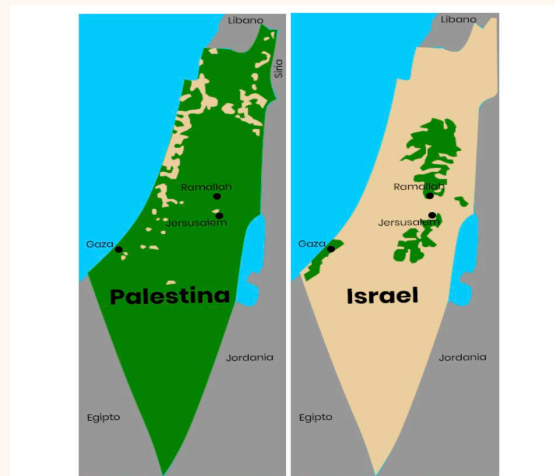
Comparativa del territorio palestino-israelí a la izquierda 1946 a la derecha 2010

Fue tras la Primera Guerra Mundial (1914-1918) que Francia e Inglaterra, en alianza con los árabes, dieron un golpe decisivo, prometiendo una ilusoria libertad e independencia al pueblo que allí se encontraba ocupado. Pero, en un giro imprevisto, estas dos potencias decidieron dividir el Oriente Medio en dos zonas de influencia: el Líbano y Siria quedaron bajo la tutela francesa, mientras que Transjordania (la actual Jordania), Palestina e Irak cayeron bajo el dominio británico.