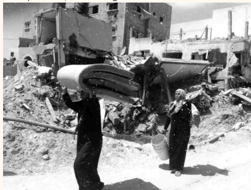
Fotografía tomada por Valeria Cortes en la Franja de Gaza

Aunque en los medios tradicionales las imágenes impactantes que retratan la violencia y los informes de víctimas civiles a menudo se convierten en foco de atención para la opinión pública, también han simplificado la narrativa compleja que hay detrás del conflicto a través de “eventos históricos”, “posiciones políticas”, “nuevos regímenes”.