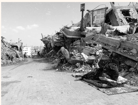
Fotografía tomada por Valeria Cortes en la Franja de Gaza

Esto a pesar de que los medios internacionales tienen el objetivo de difundir información certera siendo lo más imparciales posible. Sin embargo, el cubrimiento del conflicto palestino-israelí en algunas ocasiones nos ha dejado entrever que el sesgo informativo, la falta de información verídica, de documentos traducidos y de fuentes ha afectado la percepción del conflicto.