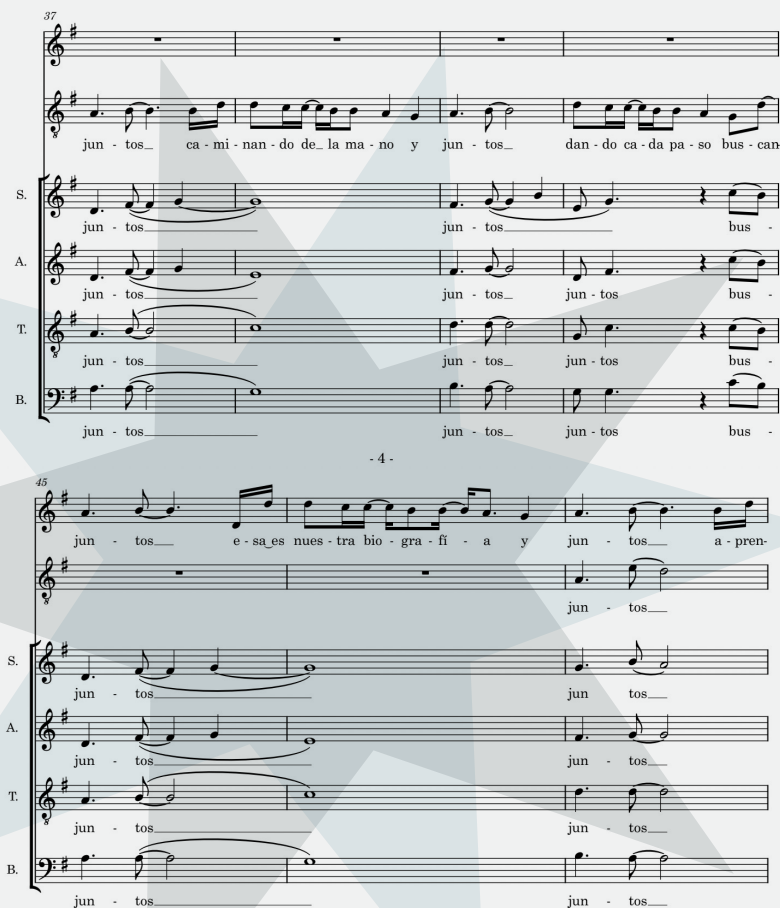
Fragmento canción Juntos