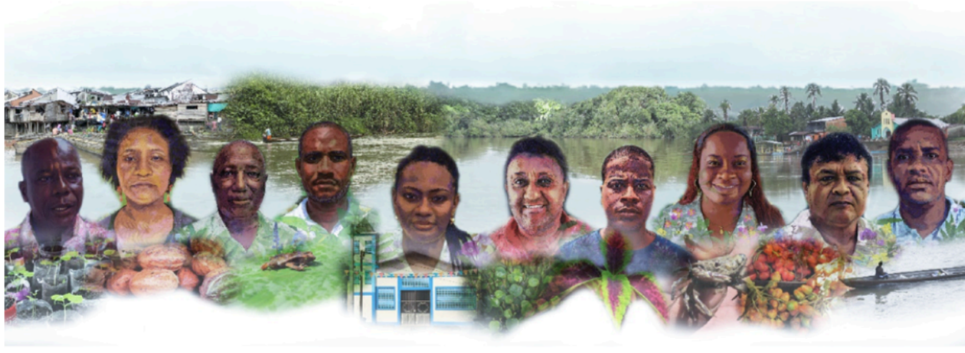
Figura 1. Mosaico de las y los Guardianes del río Atrato 3

Fuente: semillero de investigación Guardianes del río Atrato. 4