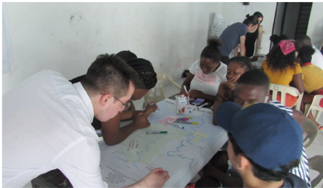
Figura 3. Taller de cartografía social. Paimadó, 2 de octubre de 2021