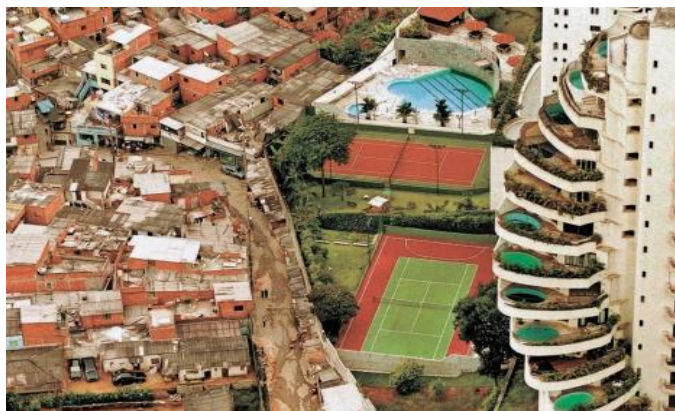
Imagen de unos apartamentos de lujo en Sao Paulo, junto a unas favelas.

Esta disparidad mundial al que se refiere Brasil en el sistema internacional, no es solo un hecho que éste observe en el concierto internacional sino que es una constante al interior de su nación. Es por ello que una de las imagines representativas del país y en especial de la “ciudad maravillosa” Rio de Janeiro son las favelas. Las cuales reflejan que la pobreza y la riqueza que van de la mano en el país de la samba. Dicho hecho no es reconocido solo al interior del país sino a nivel internacional. Por lo que uno de los paquetes turísticos que ofrecen algunas agencia en Brasil es un recorrido guiado por las favelas.