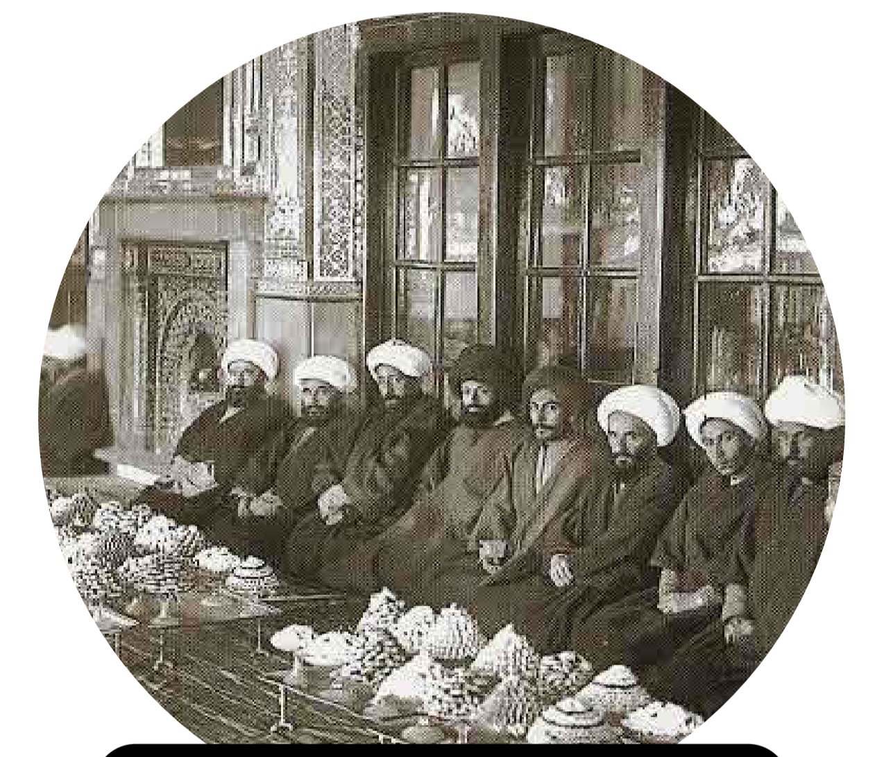
Antoin Sevruguin ulama

15 de diciembre de 1925-1935: Reza Shah pasa a llamarse Reza Shah Pahlevi, gobierna como Shah de Persia. Funda la dinastía Pahlevi.