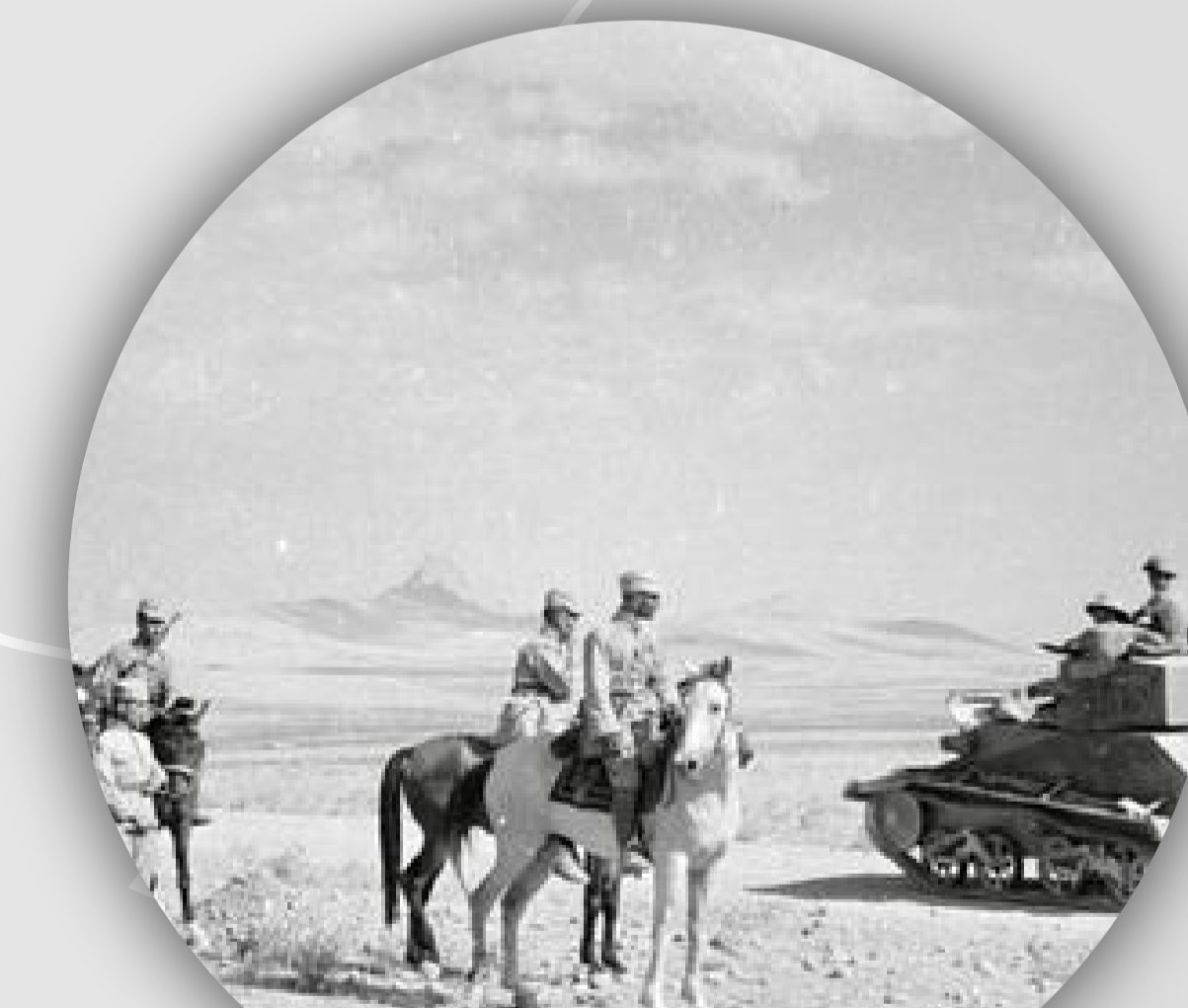
Soviet and British troops rendezvous in the desert near Quazvin

Abolió derechos especiales que tenían los extranjeros en Irán. Abrió las puertas a algunas libertades a las mujeres, introdujo la modernización de la educación, una de sus obras en este campo es la creación de la Universidad de Teherán y el envío permanente de estudiantes a Europa para completar su formación.