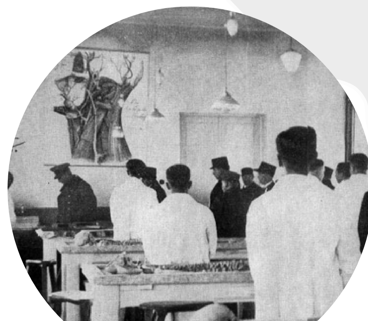
Opening Ceremony Tehran U. Medicine

Abolió derechos especiales que tenían los extranjeros en Irán. Abrió las puertas a algunas libertades a las mujeres, introdujo la modernización de la educación, una de sus obras en este campo es la creación de la Universidad de Teherán y el envío permanente de estudiantes a Europa para completar su formación.