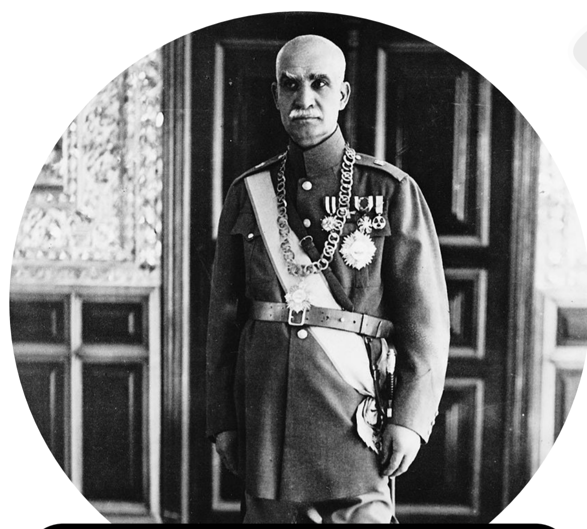
Reza Shah Bozorg

15 de diciembre de 1925-1935: Reza Shah pasa a llamarse Reza Shah Pahlevi, gobierna como Shah de Persia. Funda la dinastía Pahlevi.