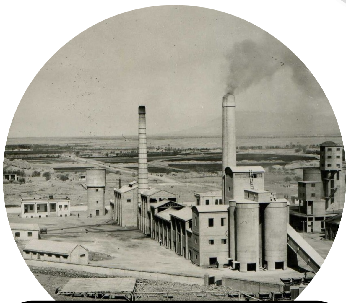
Teherán. Cement factory, c. 1930-1933

Promovió la "unificación étnica" de Persia, puso en práctica la eliminación de las diferencias sociales entre clanes y tribus. Este proceso de modernización creó tensiones con los clérigos islámicos, que Reza Pahlevi tramitó a través de la persecución y encarcelamiento de quienes se oponían a sus reformas.