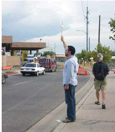
Foto 34. Vigilia en la frontera de Arizona. La lucha por el reconocimiento de migrantes y refugiados

Tomada en noviembre del 2014 por Saulo Padilla