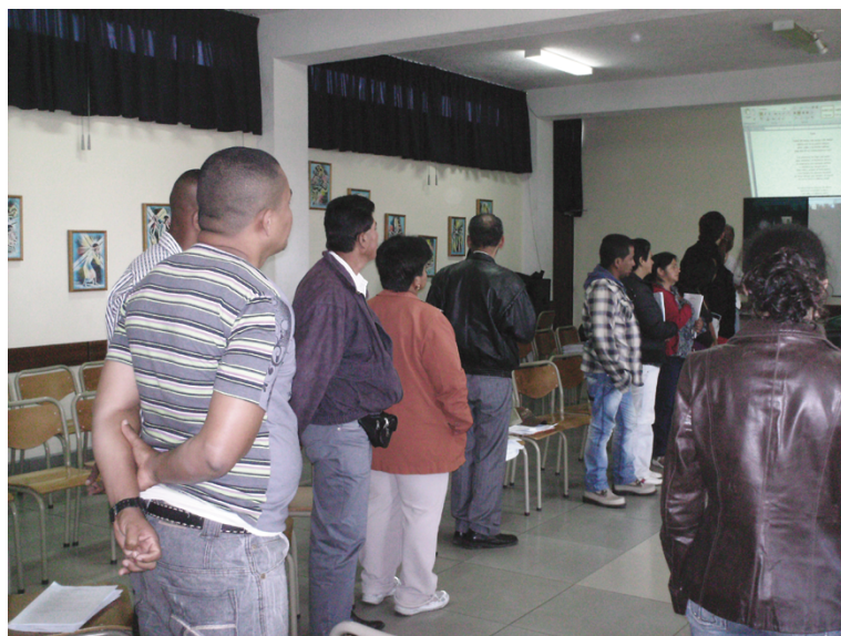
Foto 14. Encuentro de liderazgo de la Fenare, Ecuador

Tomada el 8 de abril del 2012. Recuperada de Fenare, archivo digital