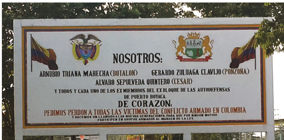
Foto 22. Un lugar de memoria de un refugiado colombiano en Canadá, 2014

cuenta con un nivel educativo universitario o técnico. Otros tienen educación básica o media.