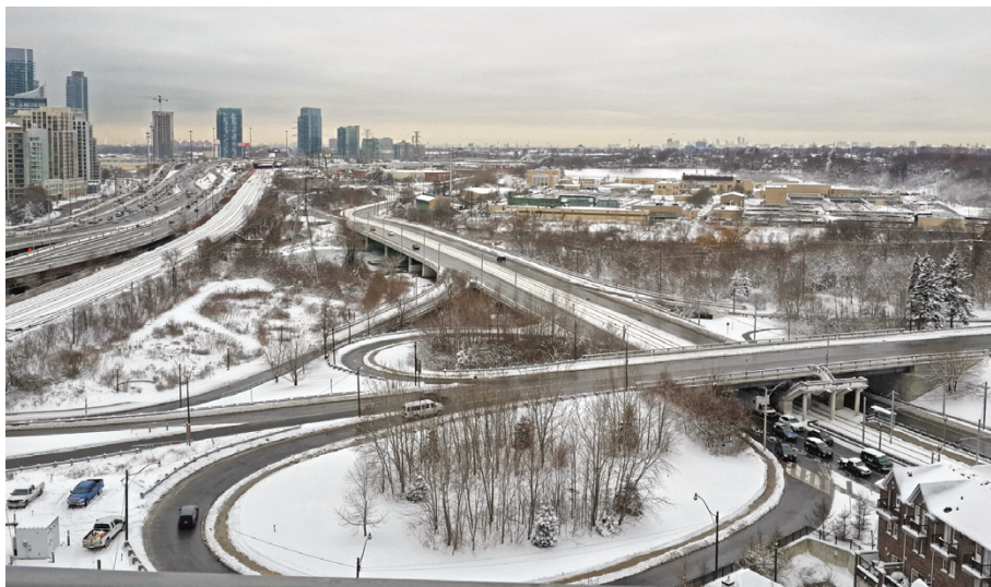
Foto 23. Mil vías en medio de la nieve

Tomada el 12 de diciembre del 2014