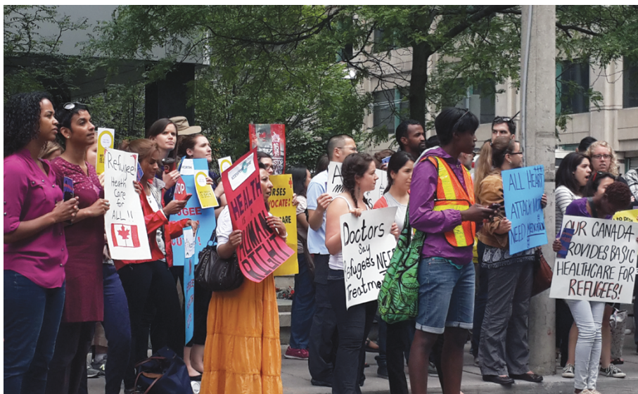
Foto 38. Movilización y organización por refugiados. Toronto, Canadá

Como lo anota Elden (2013) el territorio es una palabra, un concepto y una práctica que solo puede comprenderse desde una aproximación histórica a la relación entre esas tres acepciones. Los factores estructurales que determinan a las migraciones forzadas y las relaciones transnacionales están en el corazón de la política mundial. Siendo así, las migraciones forzadas y el refugio subsecuente no pueden carecer de dimensión política, aunque aparezca negada (Betts, 2009).