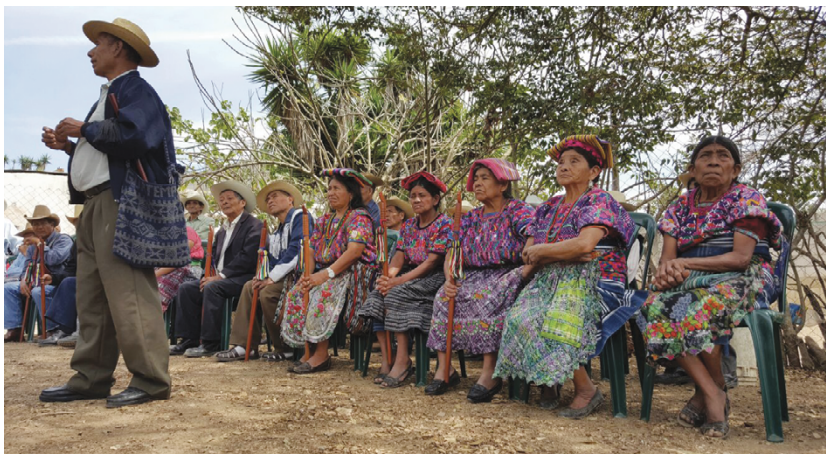
Foto 36. “Dios, humanidad y tierra”, esa es nuestra creencia. Ancianas ancestrales de la comunidad kaqchikel, Guatemala