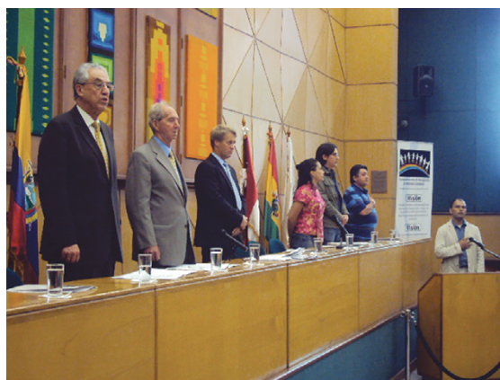
Foto 19. Evento de lanzamiento de la Fenare, Quito, Ecuador

Acnur cogió las organizaciones de refugiados de la mitad del mundo. Eso rompió la unidad. A varios de los líderes los presionaron para optar por el tercer país, influenciaron para que ninguna agencia quisiera trabajar con nosotros, y sin trabajo pues aquí no se puede. A otros les negaron la visa de refugiados, o a sus familiares, y uno teniendo que aguantarse eso. Al final, cuando ya empezamos a hacer más veeduría del Acnur aquí, ahí sí ya fue el acabose, porque intentaron dividirnos, hacernos pelear entre nosotros, y uno tratando de mediar. Ya al final no nos aguantamos y tuvimos que decirles sus verdades, ya teníamos piedra [enojo]. Ahí quizá fallamos, pero era tanta la injusticia y nosotros sin poder decir nada frente a todo ese abuso. Aprendimos a no callarnos y eso fue lo que nos frenó. Acnur casi desintegró la Fenare. (Testimonio de mujer refugiada colombiana 1, 2014)