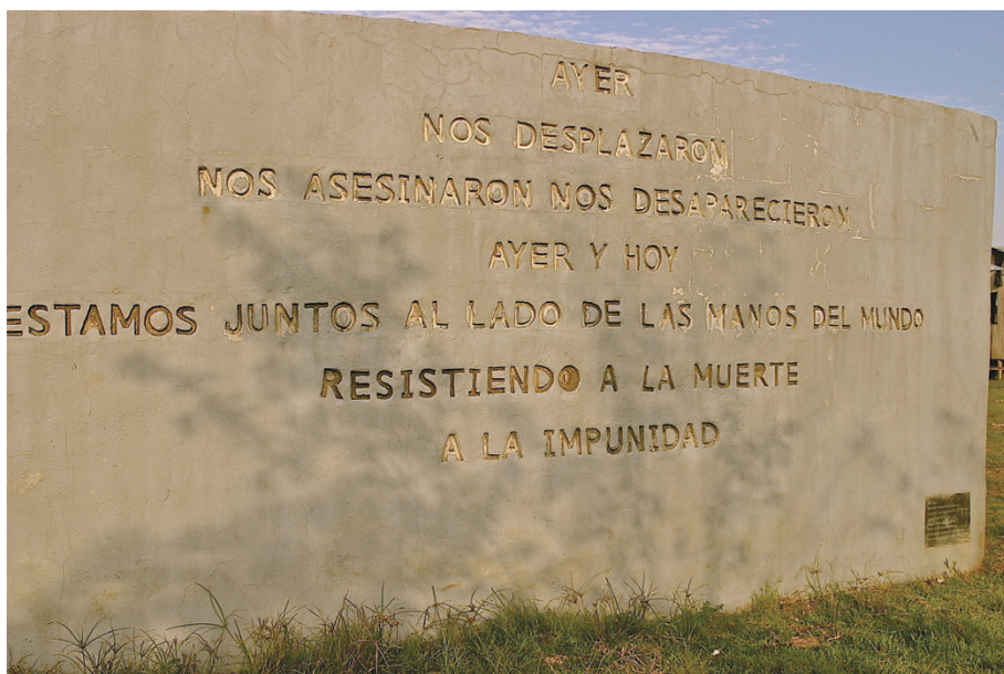
Foto 25. Monumento a las Víctimas. Cacarica, Chocó, 2012

Estos hallazgos tienen en común límites y oportunidades en medio de la paradoja del refugio. Pero ¿de qué se trata, exactamente, esta paradoja?, ¿de qué manera se expresa en la práctica?, ¿dónde tiene sus causas? y ¿qué representa para la población refugiada el reconocimiento del DIR? A continuación se presenta una serie de argumentos e hipótesis de trabajo que sirven como cauce teórico, histórico y metodológico para estas preguntas.