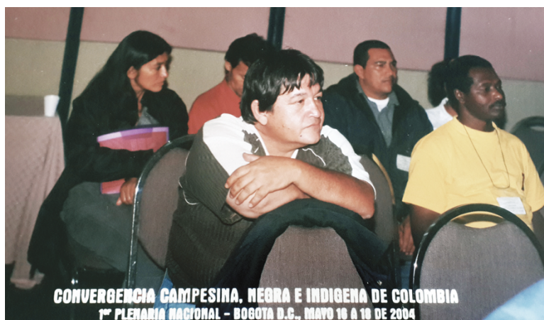
Foto 6. Participación de un líder desplazado refugiado en Ecuador. Evento Convergencia Campesina