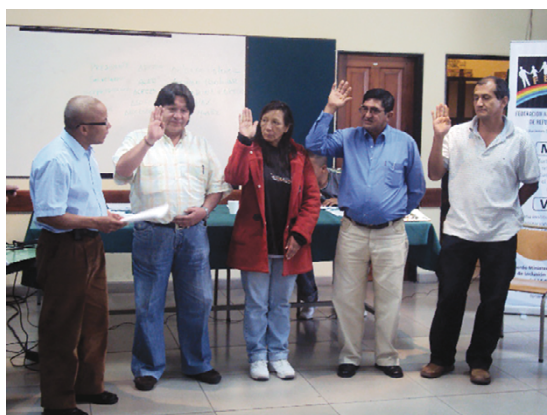
Foto 13. Encuentro de organizaciones de población refugiada, Ecuador

Las ciudades de Santo Domingo de los Colorados, Manta, Guayaquil, Lago Agrio, Ibarra, Cuenca y Quito serían testigos del complejo proceso de politización que la población refugiada colombiana emprendería en su propósito por reconstruirse nuevamente como ciudadanos de manera digna y justa, a través de la participación en la Fenare.