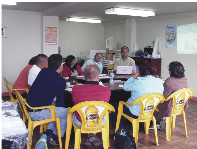
Foto 15. Reunión de trabajo Plan Decenal