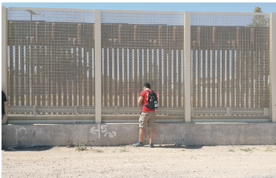
Foto 26. El refugio como inclusión-excluyente. Frontera entre México y Estados Unidos, Douglas, Arizona

Tomada el 22 de mayo del 2015