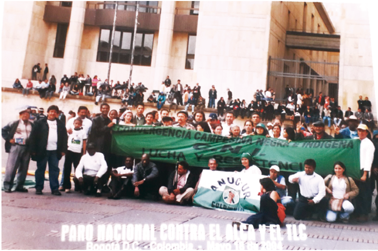
Foto 7. Participación de un líder desplazado refugiado en Ecuador antes del refugio. CND-Bogotá

Cuando salí de ahí, fui a la asamblea como invitado para regresar como representante de Risaralda; [empezó] el trabajo de escuchar y aprender cosas diferentes. Me decían “miré lo que está pasando, van a llegar más desplazados” y todo se fue acumulando. Eso fue en pleno 2003. [...] Hablé con una doctora de Acnur en un evento, le conté y ella me dijo, “esto está muy delicado, cualquier cosa mejor Ecuador, y si tiene que nombrarme, nómbrame”. Parecía fácil pero no fue así. (Testimonio hombre refugiado colombiano 1; Ecuador, 2014)