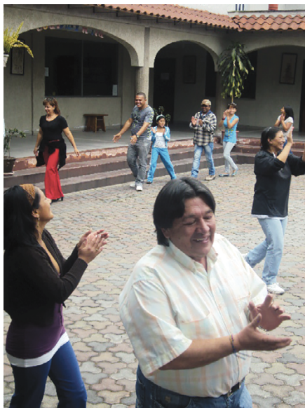
Foto 17. Encuentro de organizaciones de población refugiada, Ecuador

permitiera participar de los escenarios de decisión a través distintas actividades de cabildeo y diálogo político” (Fenare, 2010). En el plan se incorporó la idea de “capacidad de incidencia”, entendida como la posibilidad de “replantear las relaciones de poder entre la sociedad y el Estado, proponiendo espacios donde la población más vulnerable participa con voz y voto en espacios públicos, tanto para exponer sus demandas como para fortalecer los procesos organizativos” (2010, p. 4). Con esta idea se organizó, junto a la Secretaría Nacional del Migrante, las ONG Fundación Esperanza, Asylum Access y el Consejo Noruego para Refugiados, un panel de discusión sobre los avances de la política de refugio en Ecuador y, como acto de cierre, se propuso el lanzamiento de la Federación Nacional de Organizaciones de Refugiados Colombianos.