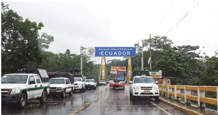
Foto 3. Frontera colombo-ecuatoriana