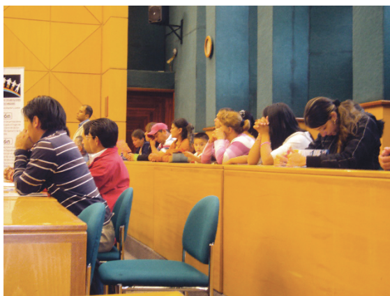
Foto 2. Población refugiada colombiana durante intervención de la Fenare sobre el refugio. Quito, Ecuador, agosto 2010