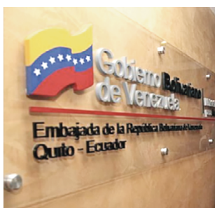
Foto 9. Embajada de Venezuela en Quito, Ecuador