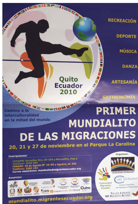
Foto 20. Afiche promocional del Mundialito de las Migraciones