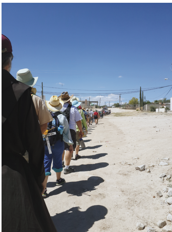
Foto 28. La globalización de los refugiados. Caminata del migrante, frontera entre México y Estados Unidos

Tomada el 25 de mayo del 2015 por Adriana Medina