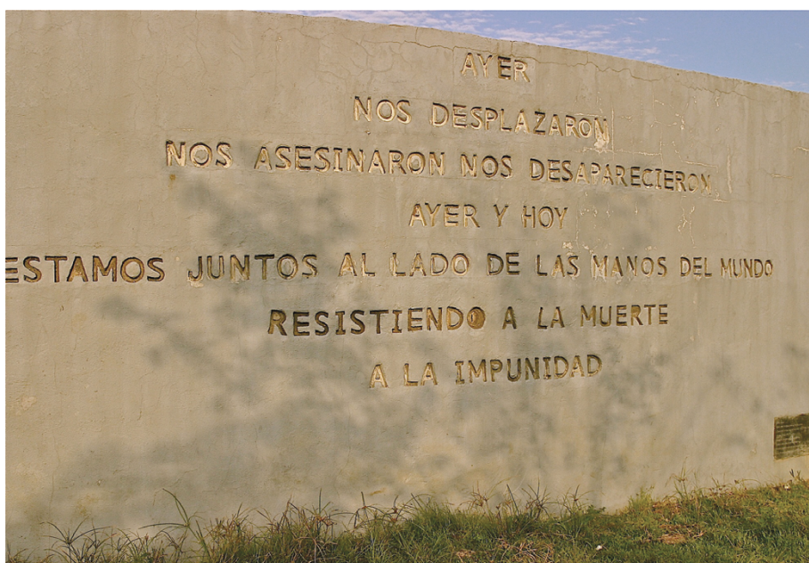
Foto 1. Monumento a las víctimas. Cacarica, Chocó, 2012