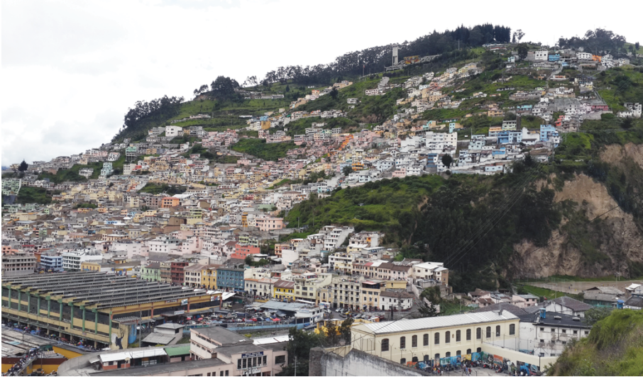
Foto 8. Quito, Ecuador