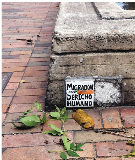
Foto 27. La paradoja. Cerámica en el eje ambiental, Bogotá