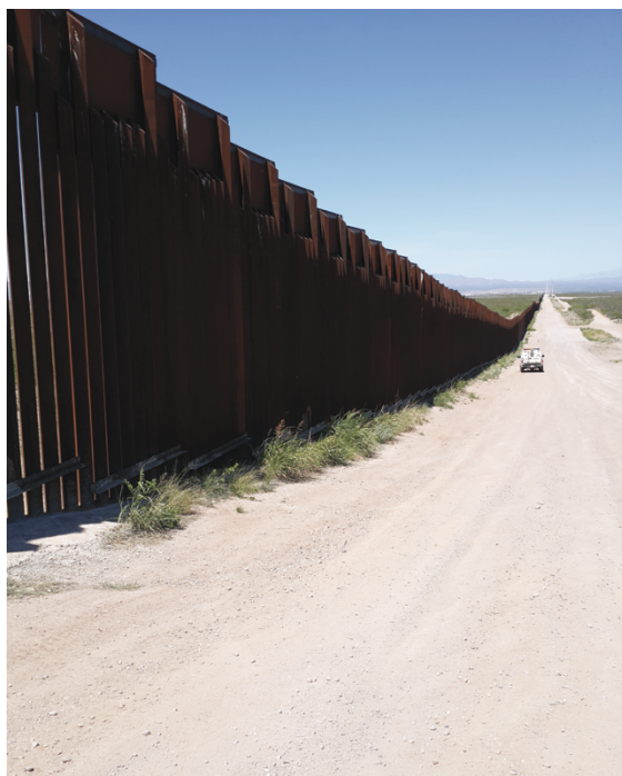
Foto 29. El refugio como herramienta de securitización. Frontera México-Estados Unidos, Douglas, Arizona

Tomada el 22 de mayo del 2015 por Adriana Medina