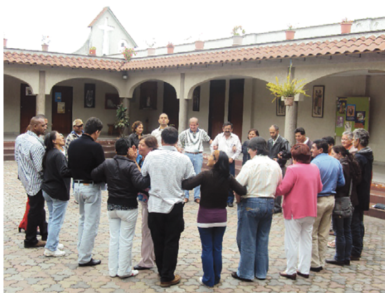
Foto 5. Taller de liderazgo de la Fenare, Ecuador

Tomada el 2 de septiembre del 2010. Recuperada de Fenare, archivo digital