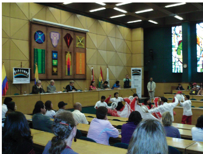
Foto 18. Evento de lanzamiento de la Fenare, Quito, Ecuador

Después de todo lo que habían pasado, la federación había alcanzado el reconocimiento público de todos los que fueron partícipes del nacimiento de la primera iniciativa con veintitrés organizaciones de refugiados colombianos oficialmente registradas por las autoridades ecuatorianas en veintiún provincias del país ubicadas en Carchi, Imbabura, Pichincha, Sucumbíos, Orellana, Esmeraldas, Tungurahua, Azuay, El Oro, Manabí y Guayas (Fenare, 2011).