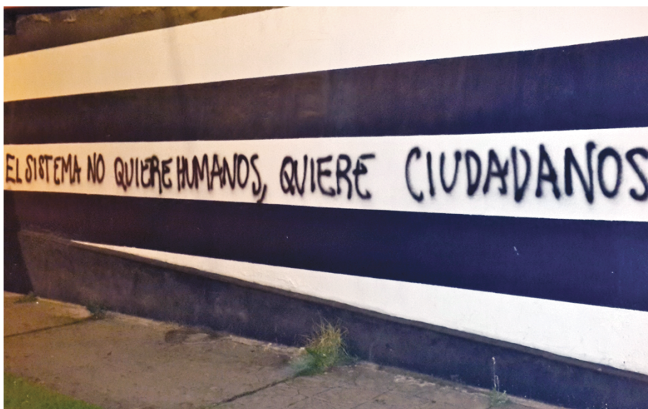
Foto 31. Grafiti en Quito