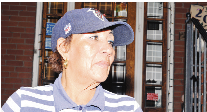
Foto 24. Los rostros del exilio y la resistencia. Toronto, Canadá