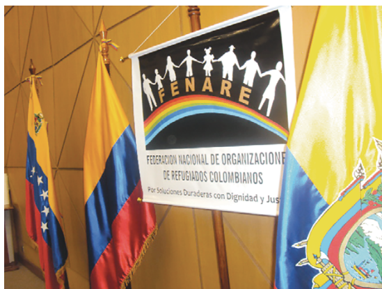
Foto 21. Fenare, Ecuador

Tomada el 10 de mayo del 2010. Recuperada de Fenare, archivo digital