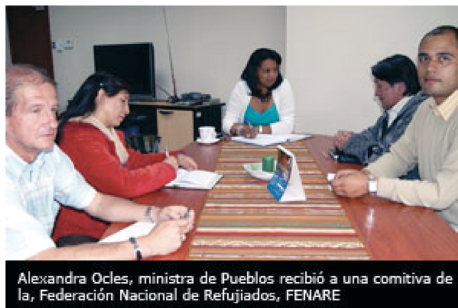
Foto 16. Encuentro entre Fenare y la ministra de los Pueblos, Ecuador

Tomada el 9 de septiembre del 2010.