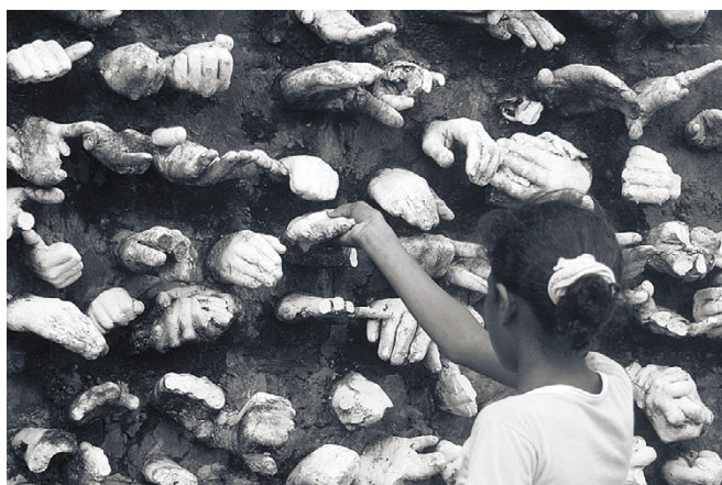
Foto 32. Joining Hands . Cacarica