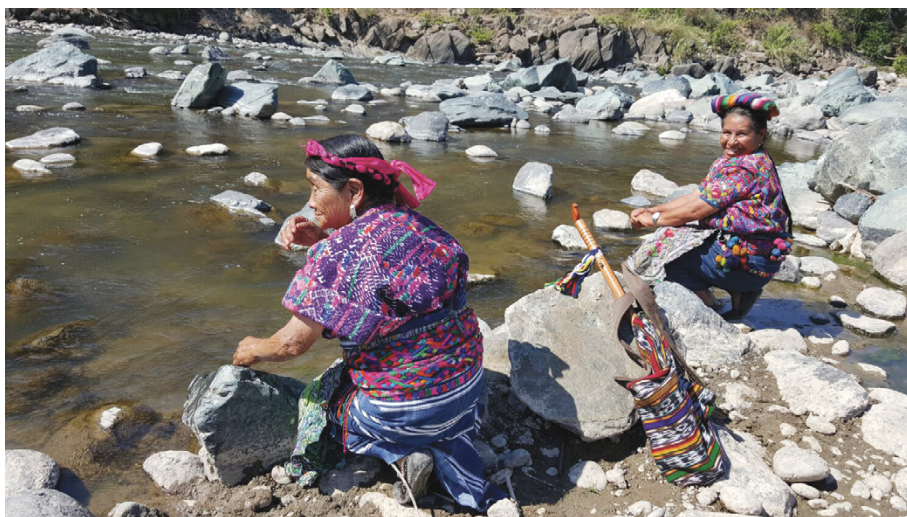
Foto 35. Si nos quitan el río nos quitan la vida

Tomada el 11 de marzo del 2016