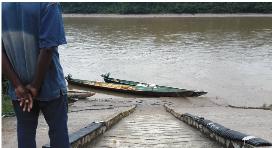
Foto 33. Límites y refugio. Frontera colombo-ecuatoriana. Desplazado refugiado colombiano

Tomada el 22 de febrero del 2014 por Adriana Medina