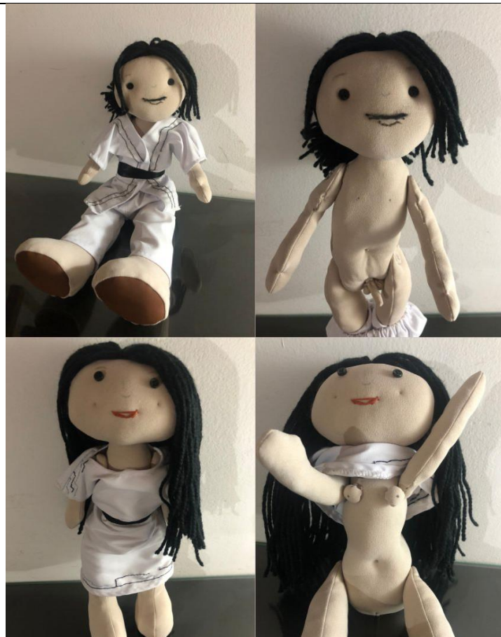
Muñecxs anatómicos Arhuacos, elaboración propia, 2023.