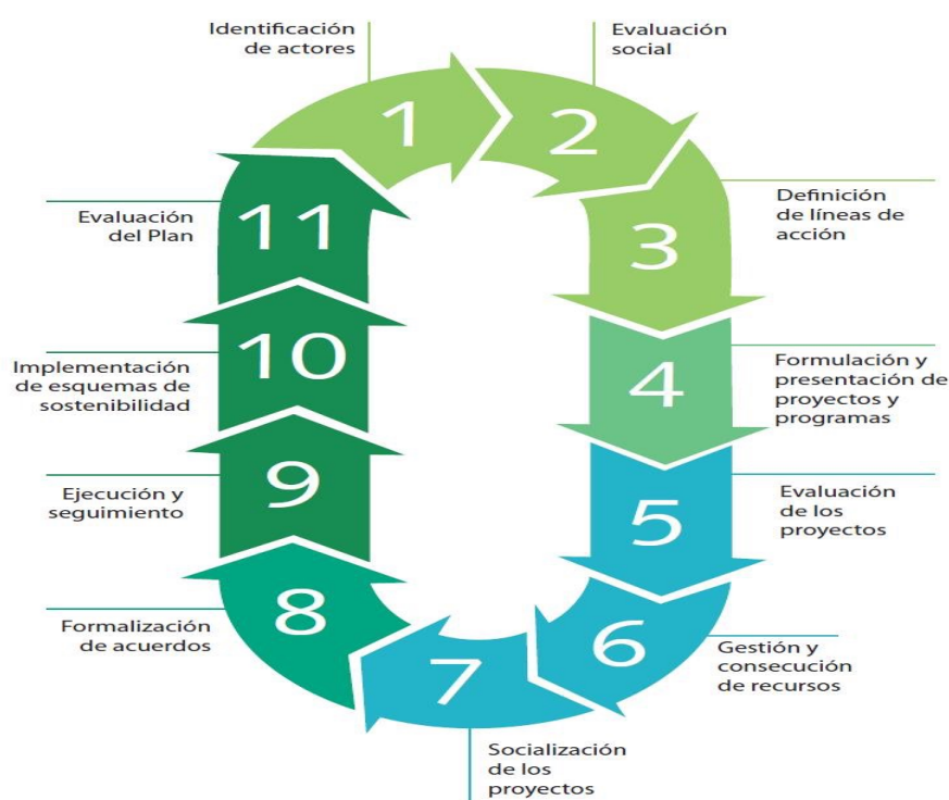
Gráfico 1. Fases de ejecución del Plan Fronteras para la Prosperidad

El Plan Fronteras ha liderado talleres participativos conformados por entidades del Gobierno nacional y del orden local, sector privado, el tercer sector y organismos de cooperación multilateral, para identificar programas, proyectos y acciones estratégicas de alto impacto en el departamento insular. El resultado de los talleres fue el establecimiento de la hoja de ruta del PFP en el archipiélago, evidenciado en el cuadro 4, el cual muestra las fases de ejecución del Plan Fronteras para la Prosperidad, que incluye la metodología del Plan.