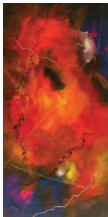
Nombre: El final Técnica: acrílico sobre lienzo Formato: pliego