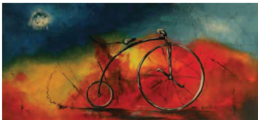
Nombre: Drasiana Técnica: acrílico sobre lienzo Formato: pliego