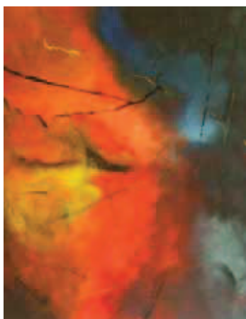
Nombre: Luces de vida Técnica: acrílico sobre lienzo Formato: pliego