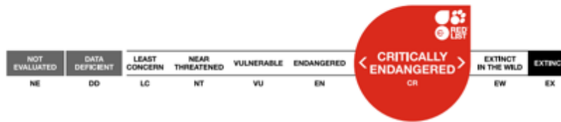
Figura 5. Ubicación del Tití Cabeciblanco en la Lista Roja de la UICN.

Nota. La figura muestra la ubicación del Tití Cabeciblanco ( Saguinus oedipus ) en la Lista Roja de especies en peligro de extinción según la UICN. Datos obtenidos de Stevenson et al. (2020).