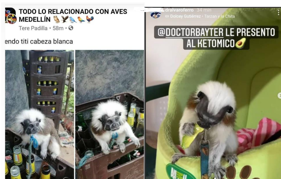
Figura 6. Ejemplo de cómo se comercializa fauna silvestre en plataformas Digitales

Esto refleja una ausencia de educación ambiental (EA) y conciencia sobre lo que significa sacar a estos individuos de su hábitat, como se observa en las siguientes publicaciones en plataformas digitales. (Figura 6)