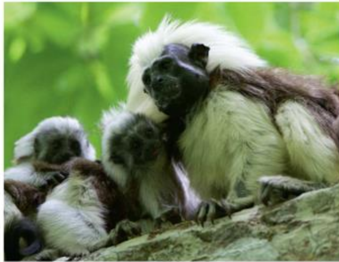
Figura 4. Tití Cabeciblanco (Saguinus oedipus).

Nota. Fotografía de un tití cabeciblanco. Foto por Joao Marcos Rosa. Imagen obtenida de (Rico, 2021), en Proyecto Tití: el esfuerzo por proteger a un primate y a un bosque en peligro de extinción en Colombia. https://es.mongabay.com/2021/04/proyecto-titi-el-esfuerzo-por-proteger-a-un-primate-y-a-un-bosque-en-peligro-de-extincion-en-colombia/