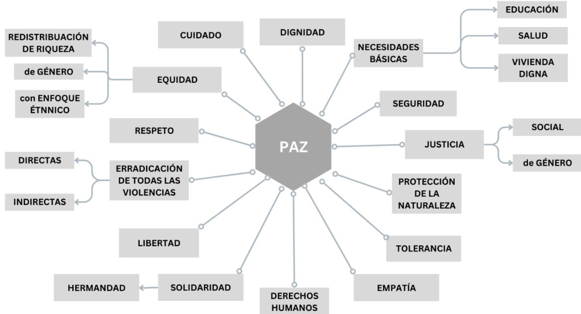
Gráfico 1: ¿Qué es la paz?

“La paz es un sueño en este país porque nunca lo hemos tenido. La paz es el sueño de mi vida.” (Teresa)