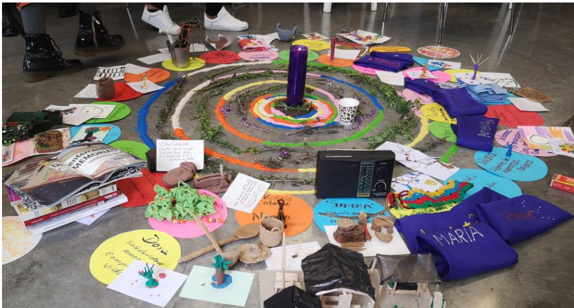
«Por la paz y la memoria: Ciudadanía activa de mujeres firmantes del Acuerdo de Paz en Bogotá D.C.»