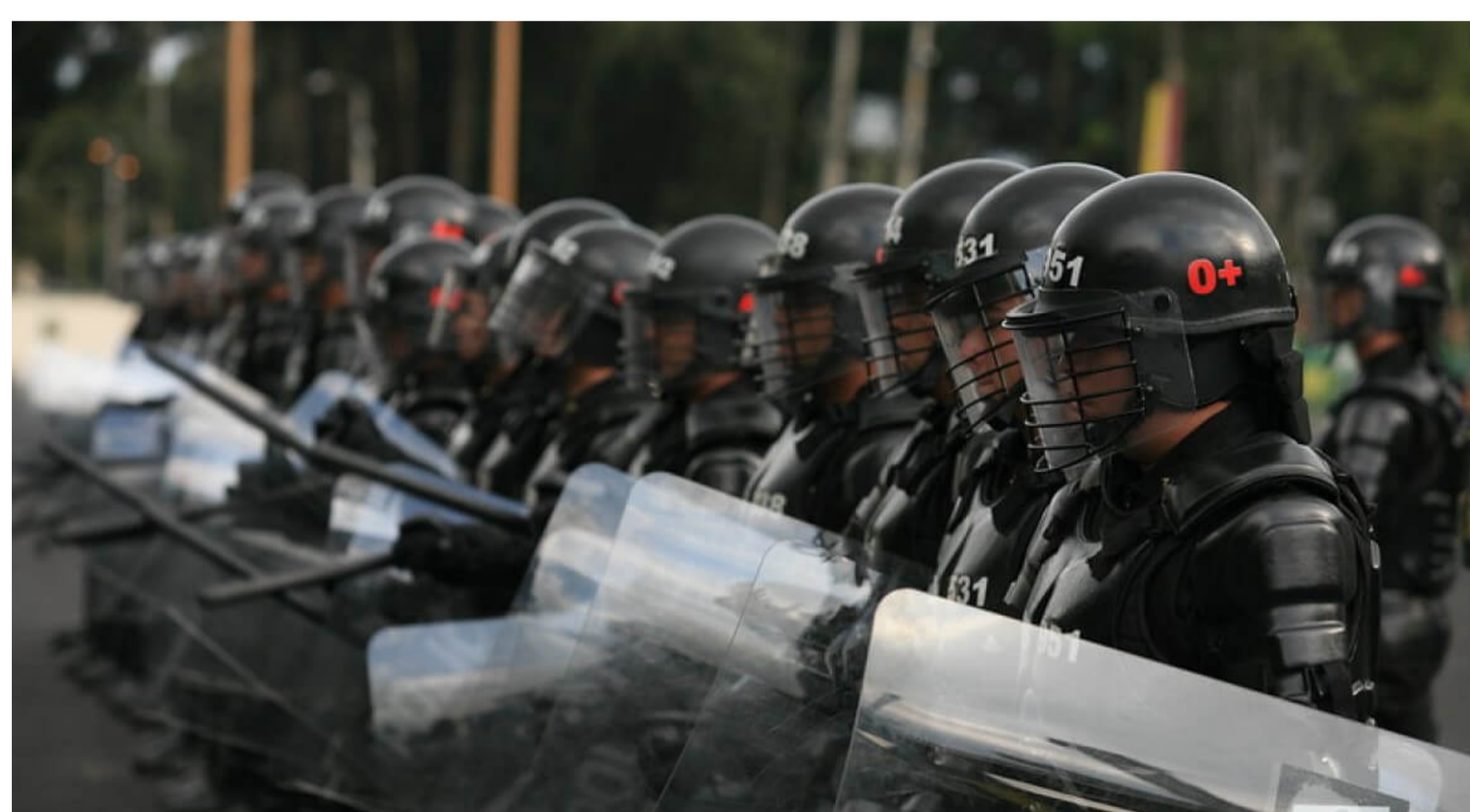
¿Qué le falta a la reforma de la policía?

“El viejo uniforme que Colombia discontinuará se inspiró en la Guardia Civil española, ya que Laureano Gómez admiraba la España franquista.”