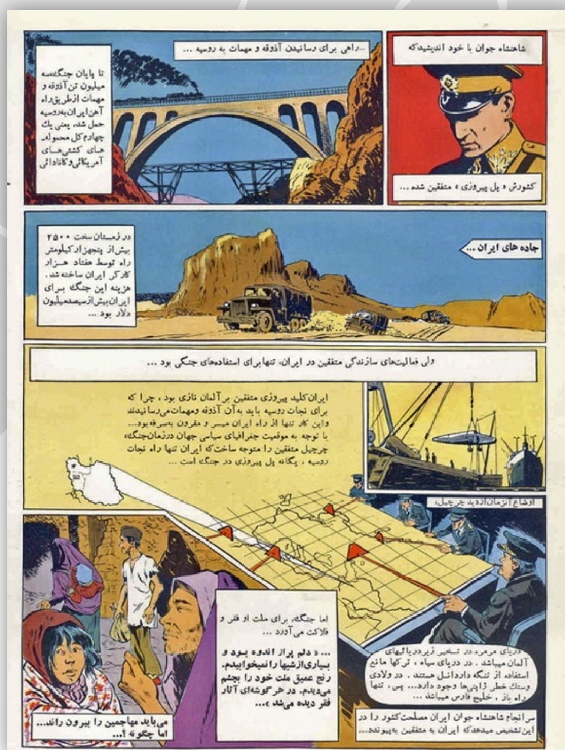
Página del libro The Regained Glory , relacionada a la invasión aglosoviética.