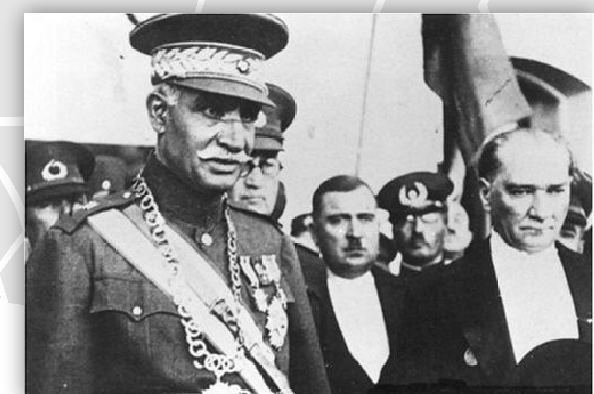
Reza Shah y Mustafa Kemal (Atatürk) Turquía. 1934

El país se declaró neutral durante la Segunda Guerra Mundial, pero luego de la invasión alemana a la Unión Soviética, tanto ese país como Gran Bretaña presionaron a Reza Pahlevi para que expulsara a los alemanes de su país, al no recibir un apoyo favorable a sus presiones la Unión Soviética y Gran Bretaña invadieron a la vez Irán lo que llevó a Reza Pahlevi a su abdicación y luego al exilio.