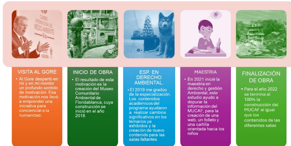
Figura 1. Línea del tiempo del Mucaf