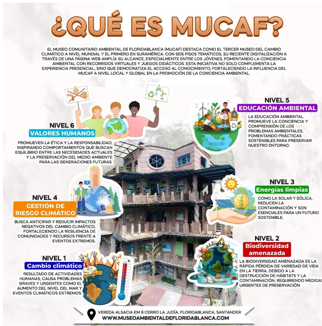
Figura 3. Presentación del MUCAF y Web