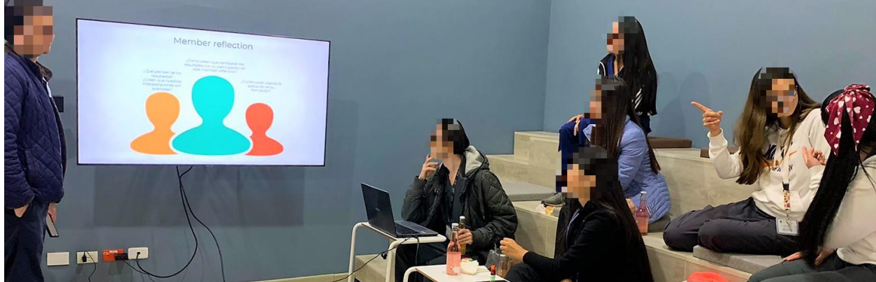
Fotografía 2. Member Reflection 27 de octubre de 2022

Por último, los estudiantes se encuentran divididos sobre continuar con el uso de la aplicación. Unos testimonios apuntan a que actualmente no la usan con tanta regularidad como lo hicieron en el mes de agosto por cuestiones de carga académica, pero que eventualmente responden un caso clínico: “No uso ahora la app. La pienso usar más adelante (...) Ahora, busco reportes de caso para ver el consolidado en distintas temáticas. Leo el texto y complemento con el caso clínico” (P15) . Por otra parte, otros estudiantes refieren que no la volvieron a tocar y algunos la desinstalaron porque al ser en inglés se les dificulta mucho entender los casos. Pero que gracias a su participación en este estudio, entendieron lo importante de involucrar un recurso tecnológico (material) para el aprendizaje del razonamiento clínico y han intentado con otros recursos como Clinical Key y Medscape en español.