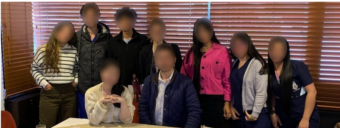
Fotografía 1. Grupo focal 17 de septiembre de 2022

Los hallazgos principales revelaron que Human Dx participa en el aprendizaje de razonamiento clínico de los estudiantes por medio de tres mecanismos generales interrelacionados: Interactuando directamente con la aplicación, contactando con otros agentes materiales y actores humanos, y construyendo procesos cognitivos. A continuación, se describirán estos tres mecanismos generales ilustrándolos con los discursos más representativos dados por los participantes. Se utilizó un mapa situacional para representar el ensamblaje de los estudiantes y la aplicación con nuevos actores humanos y agentes materiales.