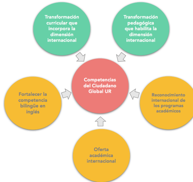
Gráfico 1. Líneas de acción de Proyecto Académico Lineamientos Académicos: internacionalización del currículo y bilingüismo (2018) Dirección Académica

internacionalización del currículo y el bilingüismo (2018) donde se consignan cinco líneas de acción (grafico 1) para facilitar la comprensión del proyecto y dimensionar su alcance en cada uno de los programas académicos, así como asignar los recursos necesarios para implementarlo.