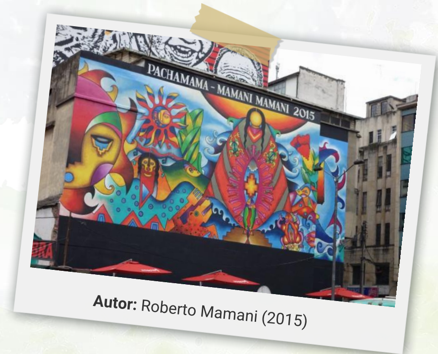
Autor: Roberto Mamani (2015)

El imaginario de la Madre Tierra es profundo y de gran impacto emocional. Sin embargo, la desvalorización de la naturaleza y la de la mujer (pensadas como seres pasivos o como meros recursos) van juntas en esa imagen. De hecho, la idea de la Madre Buena es una idealización: las mujeres dan vida, pero con eso abren la vía hacia la muerte; el amor de madre incluye matices difíciles: las madres castigan a sus hijos y a veces fallan en su labor; la experiencia real de ser mamá es gratificante, pero a la vez agotadora, y nutre el ideal de la mujer como ser que se sacrifica por su familia.