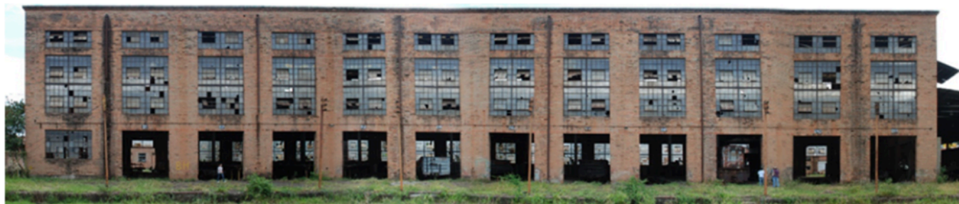
Figura 6. Edificio de Talleres Diesel, centro del conjunto ferroviario