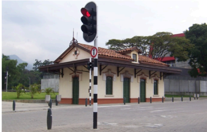
Figura 4. Estación El Bosque y Parque Explora

y científico, como también simbólico y testimonial, es un reflejo de lo que fue la vocación y desarrollo industrial de la capital de Antioquia durante casi un siglo (figura 6).