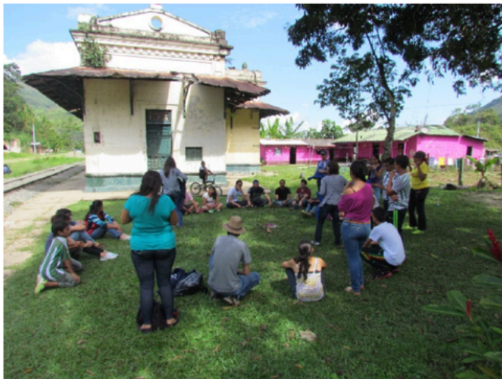
Figura 2. Taller con grupo de vigías de patrimonio en la estación El Limón