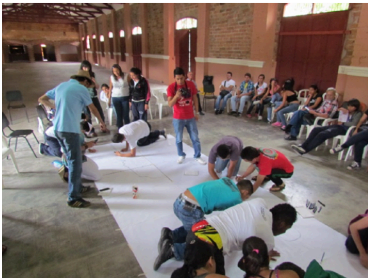
Figura 3. Taller con grupo de vigías de patrimonio en la estación Cisneros