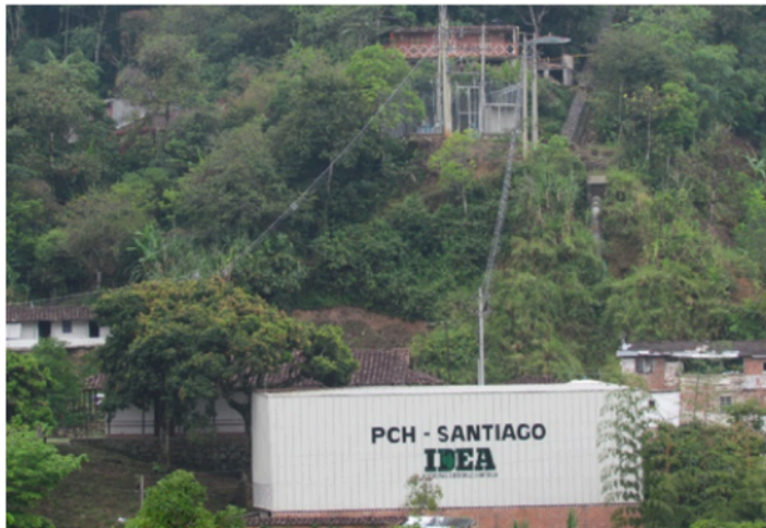
Figura 5. Estación Santiago y micro central hidroeléctrica