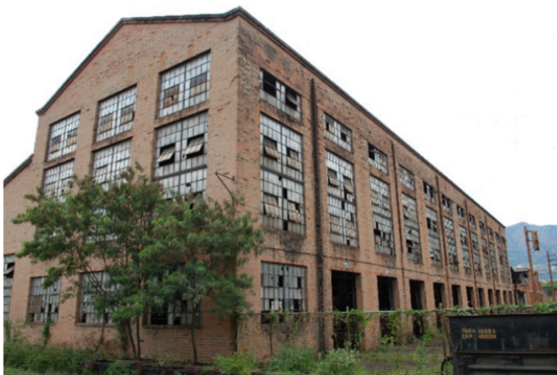
Figura 11. Vista exterior del edificio de Talleres Diesel en el conjunto de Bello