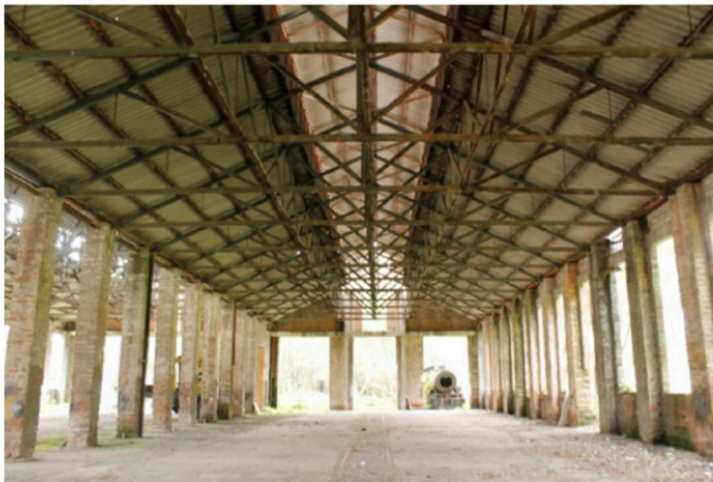
Figura 10. Vista interior del edificio de material rodante en los Talleres de Bello