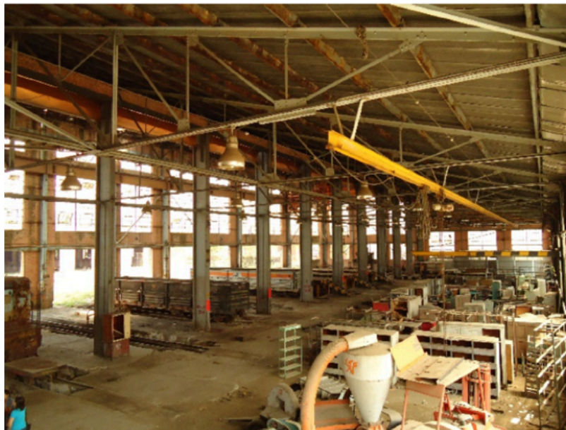
Figura 12. Vista interior del edificio de Talleres Diesel en el conjunto de Bello