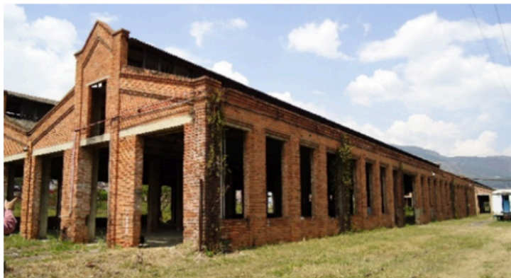
Figura 9. Vista exterior del edificio de material rodante en los Talleres de Bello