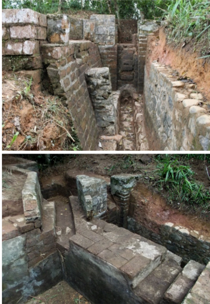
Figura 1. Vestigios de acueducto del Ferrocarril de Antioquia

Nota: estos vestigios fueron encontrados en la prospección arqueológica realizada en las inmediaciones de la estación Botero. Hoy forma parte del inventario de arqueología industrial y ferroviaria del ICANH.