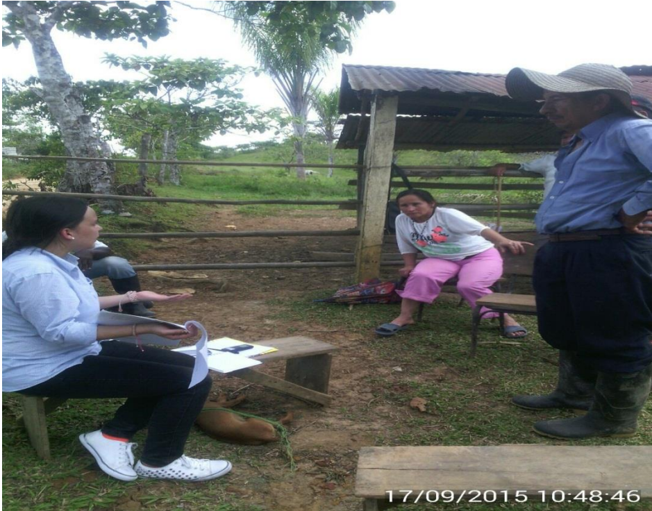
Fotos tomadas el día de la entrevista.