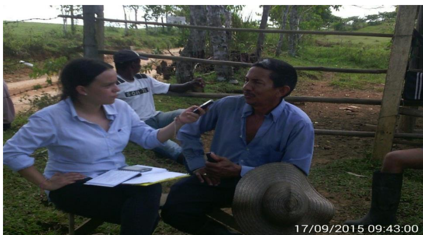
Foto tomada el día de la entrevista.