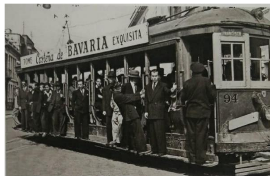
Tranvía eléctrico de San Francisco 1944