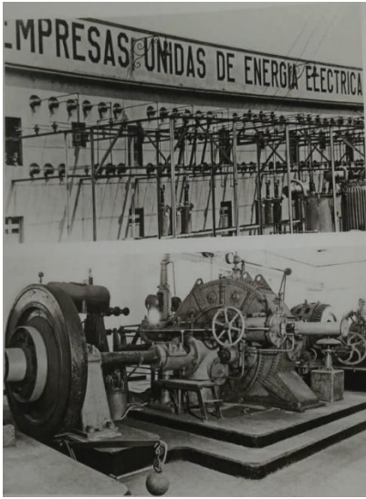
Empresas Unidas de Energía Eléctrica- Nuevas plantas de generación, 1930