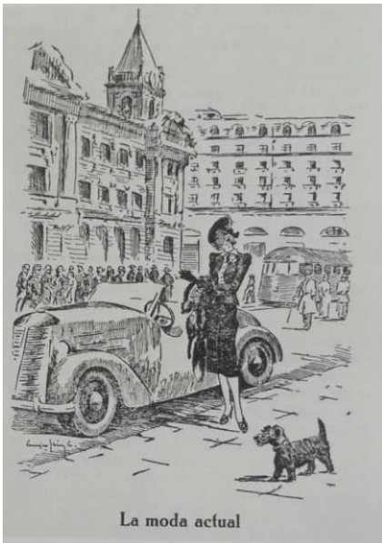
La avenida Jiménez. Al fondo, la fachada del palacio de San Francisco, el tranvía, la torre de la Iglesia de San Francisco. Dama elegante, con un atuendo a la moda (1936- 1938)