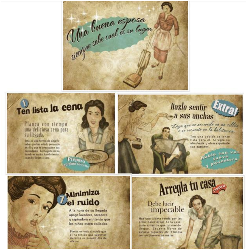
Guía de la buena esposa (1953)

en la que la mujer estaba supeditada al varón, tanto a los hijos como a los padres” (El Estado, 20018).