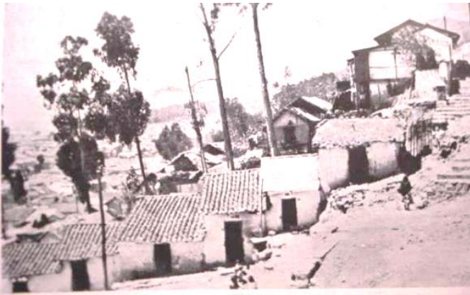
Fuente. El Sector de Saneamiento Paseo Bolívar en Bogotá 1935 en: Manual de Urbanismo, 1939.