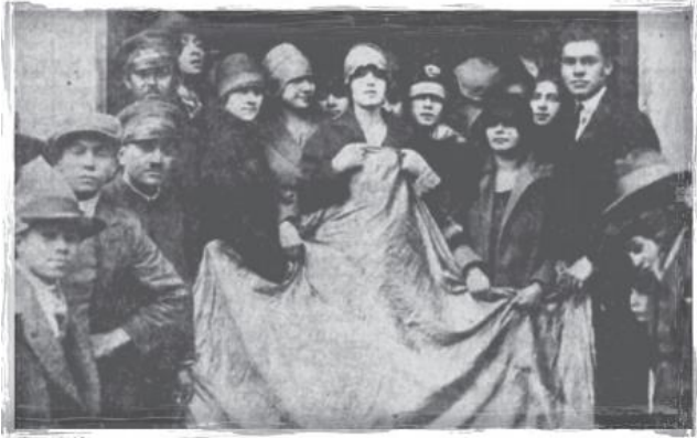
“Las señoritas telefonistas en la puerta del edificio con la bandera colombiana”

Fuente: Felacio, C (2012) La huelga de las telefonistas: Condiciones, problemas y manifestaciones de las mujeres obreras a comienzos del Siglo XX en Bogotá. Revista Bogotá paz-ando Vol. 5, N° 1.