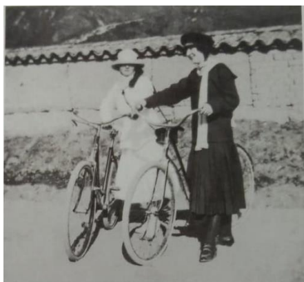
Grupos femeninos ostentaban elegancia y belleza se desplazaban en bicicleta por Bogotá (1930)