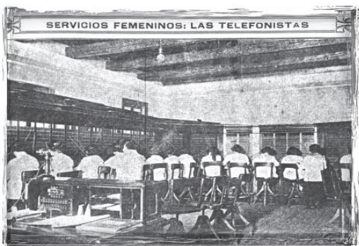
Central de teléfonos de Bogotá años 20 y 30. Solo hasta los años 40 se hicieron gestiones para establecer el servicio automático de teléfonos.

El teléfono era otro lujo durante la década de los 30 y 40, ya que tenía diferentes costos, en cuanto a las llamadas y las instalaciones. A su vez, cambió la percepción de las distancias, ya que se entraba en contacto con otros lugares de la ciudad y más adelante del país. A pesar de ser un objeto lujoso dentro de las clases altas, al principio se desconfiaba de la efectividad al contactar con personas que se encontraban en otros espacios (Blanco & Salcedo, 2012). Otro aspecto importante para mencionar es la labor de las telefonistas, ya que hicieron parte de ese pequeño grupo de mujeres que trasgredieron su labor en el hogar o en el convento, para entrar al mundo laboral, sin embargo, así como les daba importancia en la economía familiar, también implicaba nuevas formas de explotación. Lo que llevó a una huelga de telefonistas en 1928 en Bogotá