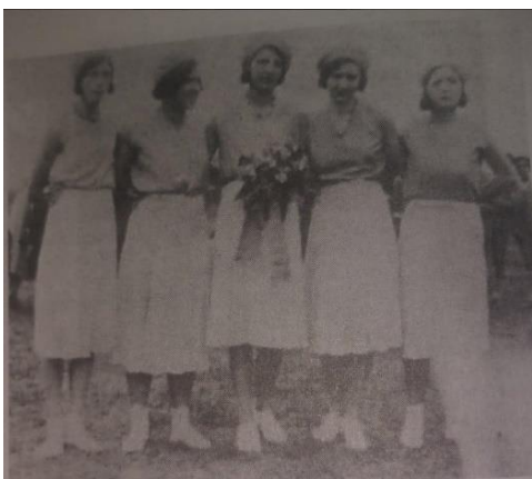
Equipo de tenis femenino en el Country Club Bogotá (1930)

Por otro lado, las mujeres de clase alta tenían la oportunidad y la facilidad para practicar en su tiempo libre la pintura, la música y/o la costura. Mientras que las mujeres de clase obrera solo podían aspirar a ser lavanderas, cocinar y empleadas del servicio (López-Uribe, 2011). No tenían espacios de socialización, ni de esparcimiento, así como tampoco el tiempo ni los ingresos para invertirlos en diferentes actividades, el espacio más cercano eran las chicherías, ya que este no tenía distinción de género.