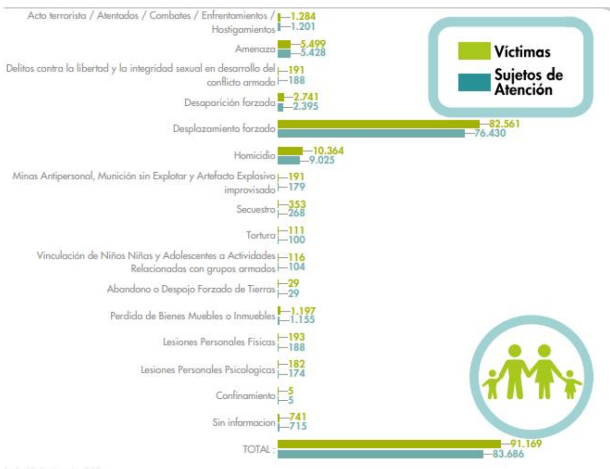
5 Gráfica 5. Víctimas y sujetos de atención en Arauca.

En el caso particular de Arauca, según los datos, han sido 91.169 las víctimas registradas, de las cuales 83.686 han sido sujetos de atención y reparación, tal como se muestra en la gráfica 5 . Allí aparecen desglosados cada uno de los hechos victimizantes, siendo el desplazamiento forzado el que cuenta con mayor número de víctimas, seguido de las amenazas y las desapariciones forzadas.