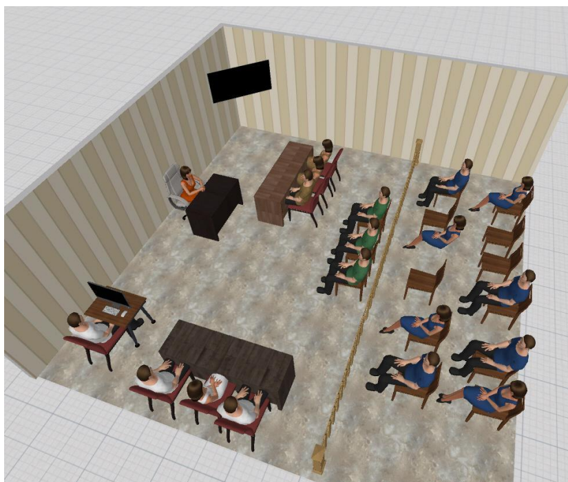
3 Gráfica 3. Sala 1 de Justicia y paz. Bogotá. Elaboración propia

reafirma “una división del trabajo que se determina mediante la rivalidad estructuralmente reglada entre los agentes y las instituciones” (Bourdieu, 2000, p. 161).