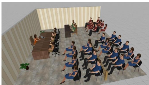
4 Gráfica 4. Sala 2 de Justicia y Paz. Elaboración propia

La segunda sala donde se desarrollaron las audiencias tenía un orden similar. Así, la magistrada a la cabeza del auditorio, los delegados de la procuraduría y la fiscalía en la primera fila de la sala, los representantes de víctimas y de los postulados en una mesa situada al costado derecho de la sala. Los postulados eran varios y estaban situados al costado izquierdo de la sala, divididos entre ellos por una reja, según se muestra en la gráfica 4 . Las víctimas en esta sala se encontraban recluidas en una de las esquinas de la sala; había pocas sillas, aunque no era grande la cantidad de víctimas presentes en el espacio; las veces que asistí, generalmente eran entre 3 y 7 las víctimas participantes de la sala.