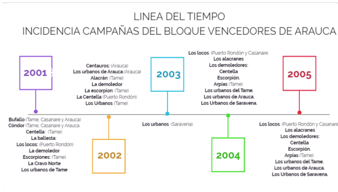
2 Línea del tiempo. Incidencia campañas del Bloque Vencedores de Arauca. Elaboración propia

Según se ha establecido, el fin primordial de esta estructura era