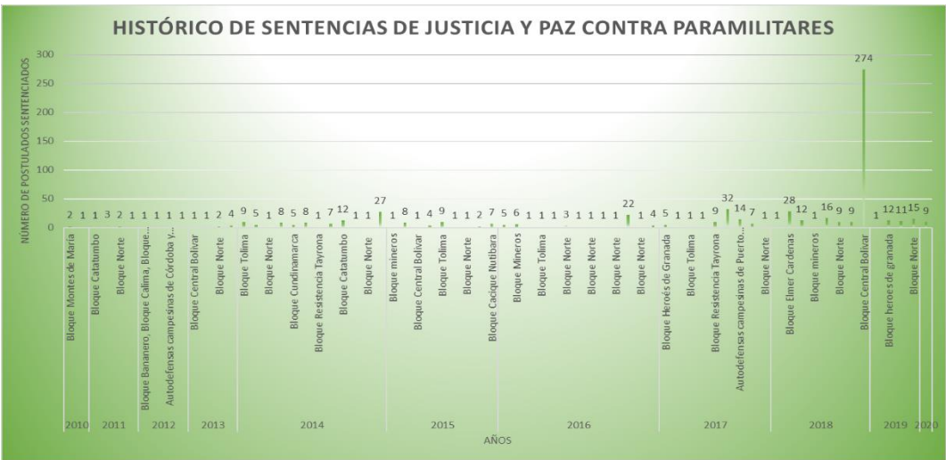
Tabla 1 Histórico de sentencias de justicia y paz contra paramilitares. Elaboración propia

En la figura 1 aparece el histórico de sentencias de justicia y paz contra paramilitares desde 2010, fecha de expedición de la primera sentencia. Como se puede observar en la tabla 1 , en los primeros años del 2010 al 2013 se ejecutaron tan solo 7 sentencias; los años siguientes, del 2014 al 2016, son los años que tienen mayor número de sentencias, luego de realizadas las investigaciones pertinentes de los casos; en estos años se generaron condenas contra 167 postulados paramilitares de diferentes Bloques, particularmente del Bloque Norte, estructura armada que generó control territorial y acciones criminales en los departamentos de Magdalena, Cesar, La Guajira y Atlántico.