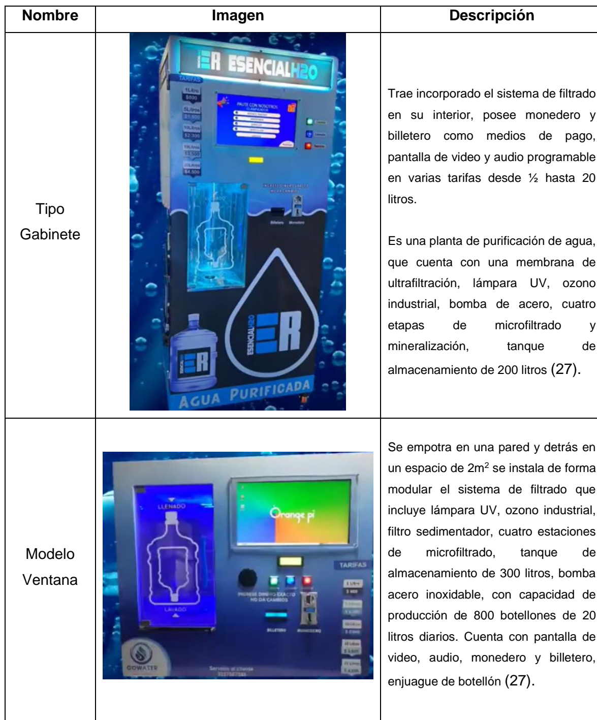
Tabla 1. Tipos de máquinas dispensadoras de agua