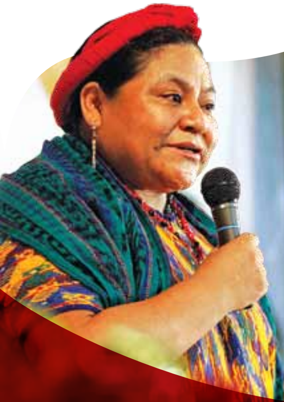
Rigoberta Menchú Premio nobel de paz