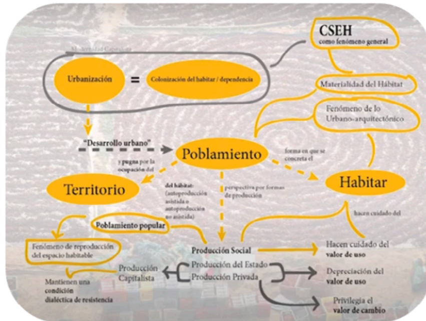
Figura 1. Conceptos clave de la línea ADCP

A partir de una investigación realizada por el grupo de HABYTED-CYTED publicada en tres libros, al respecto se encontró que, en primera instancia, en el caso de