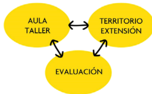
Figura 3. Procedimiento metodológico de la cátedra VIS

El procedimiento metodológico empleado sobre la propuesta práctica refiere a dos modalidades: el aula taller y trabajo en el territorio (extensión participativa).