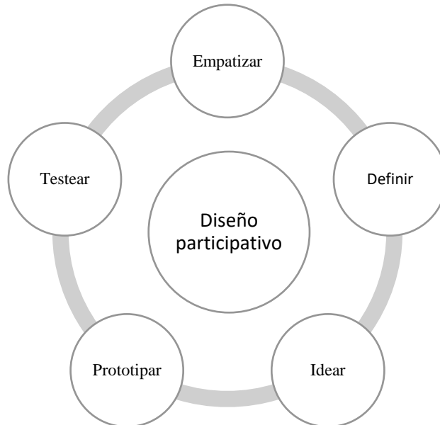
Ilustración 1 Fases de la metodología design thinking. Elaboración propia

Las etapas principales de los proyectos de diseño participativo se constituyen en pasos guías para recorrer de manera colectiva entre participantes, coinvestigadores y miembros de la comunidad (Garcés, 2020, pág. 211). Por ejemplo, el pensamiento de diseño o el design thinking es un método utilizado en el ámbito del diseño para desarrollar soluciones creativas y situadas a los contextos locales, dentro de las cuales es posible establecer diferentes métodos, técnicas y herramientas acordes al nivel de compromiso, la experiencia e intereses de los participantes y la experiencia de los coinvestigadores “como facilitadores y mediadores en el planteamiento de un pensamiento sistémico” (Garcés, 2020, pág. 211).