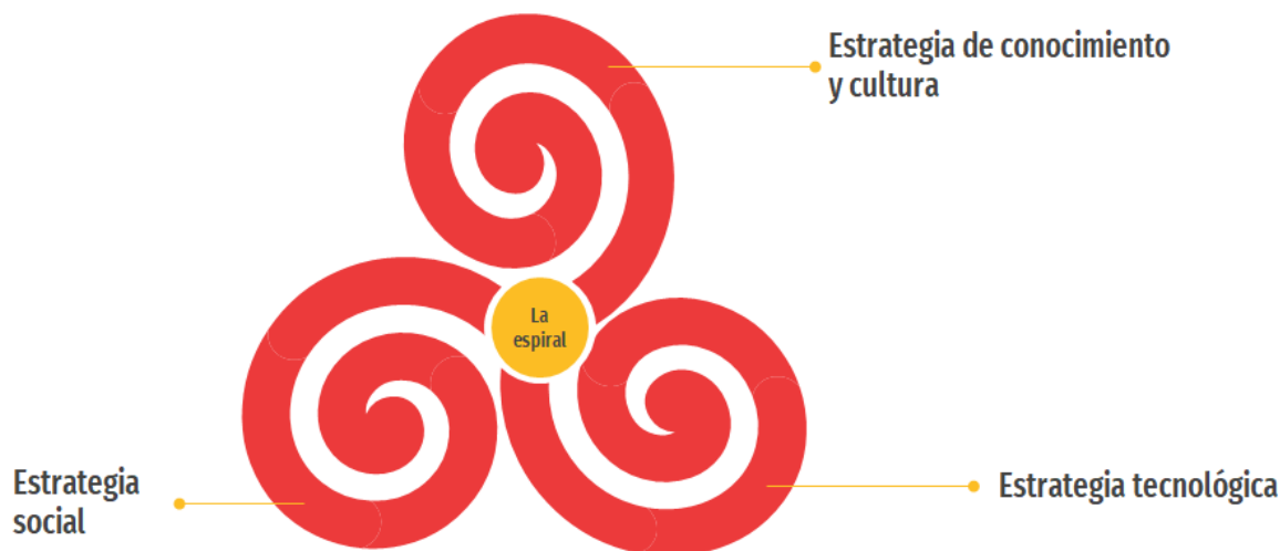
Ilustración 3 Modelo de gestión cultural metodología La espiral

La aprobación e inclusión de la metodología cultural dentro de la vigencia del plan de vida asegurará los recursos mínimos para su ejecución y el aval para la búsqueda posterior de aliados, recursos y financiación.