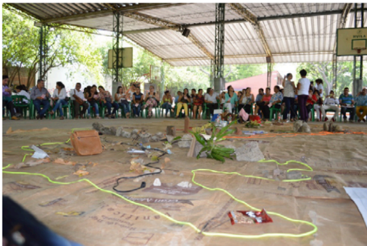
Figura 1. Cartografía social elaborada por profesores de la zona rural de Neiva