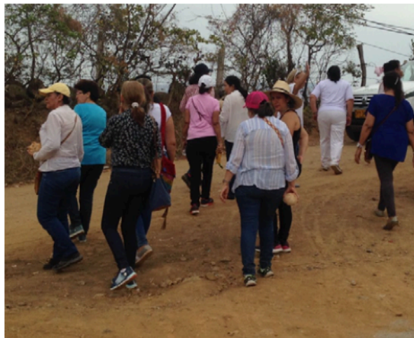
Figura 3. Salida de campo en la Comuna 2 de Neiva