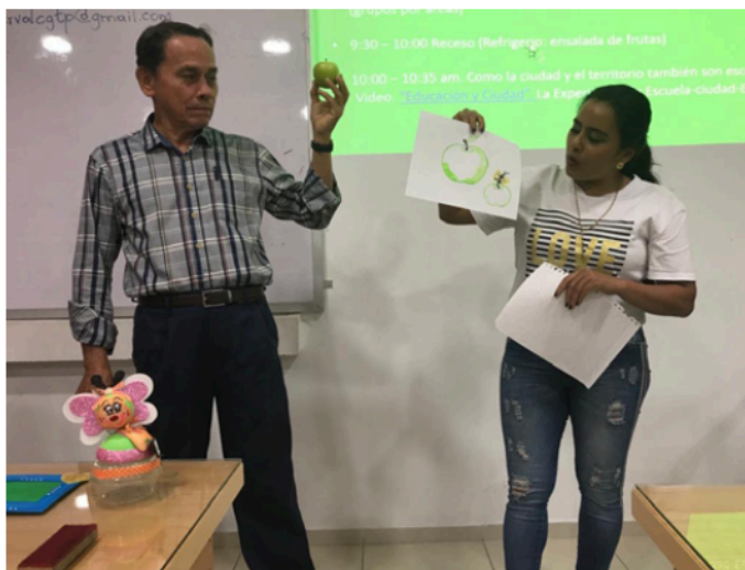
Figura 4. Taller de integración curricular con profesores de secundaria