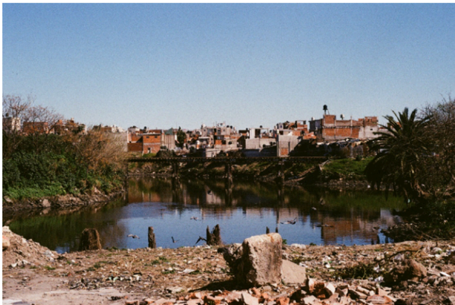
Figura 2. Ribera de la Villa 21-24 de Barracas en la ciudad de Buenos Aires

El PISA tuvo más de diez líneas de acción que abordaron la complejidad de la problemática ambiental de la cuenca. Entre ellas encontramos las de “contaminación de origen industrial”, “saneamiento de basurales”, “ordenamiento ambiental del territorio”, “liberación de márgenes y camino de sirga”, “urbanización de villas y asentamientos precarios” y “expansión de la red de agua potable y saneamiento cloacal”. Una parte importante de las acciones delineadas en el plan (en particular las nombradas) tenían por objeto los asentamientos informales localizados en la cuenca y sus habitantes y, en especial, aquellos radicados en la ribera a lo largo del río. Las políticas vinculadas a