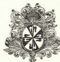
Nova et vetera