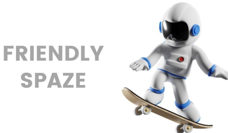
Imagen Friendly Spaze

Nota: Ilustración de astronauta tomada de Canva for Education con licencia para fines educativos.