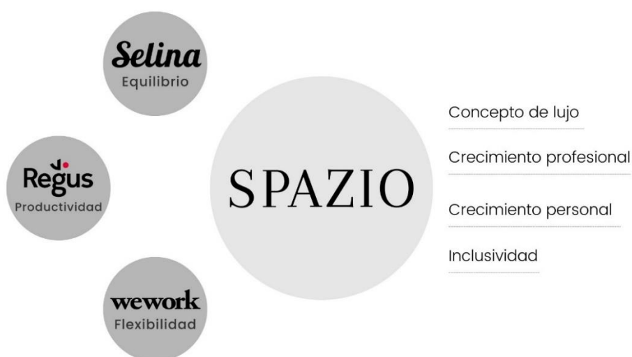
Gráfico competencia Spazio