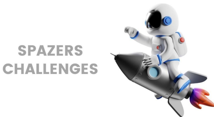
Imagen Spazer Challenges

Nota: Ilustración de astronauta tomada de Canva for Education con licencia para fines educativos. Fuente: Elaboración propia.