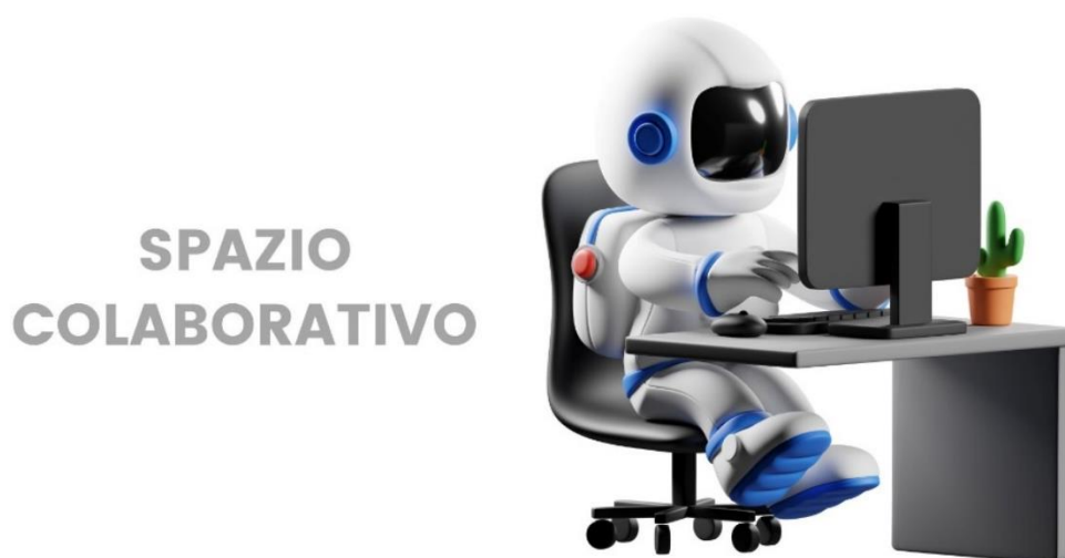
Imagen Spazio Colaborativo

Nota: Ilustración de astronauta tomada de Canva for Education con licencia para fines educativos.