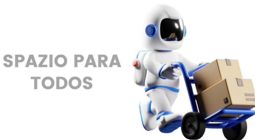
Imagen Spazio para todos

Nota: Ilustración de astronauta tomada de Canva for Education con licencia para fines educativos. Fuente: Elaboración propia.