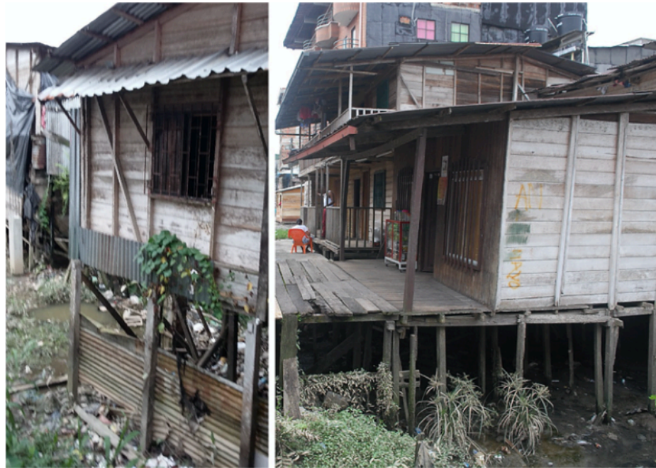
Figura 9. Palafitos en la Quebrada La Yesca, barrio La Yescagrande

han adoptado enfoques críticos para las modificaciones históricas del patrimonio, creando experiencias arquitectónicas en el diseño de la conservación. Estos aspectos fueron explorados por los estudiantes e instintivamente generaron ideas para hacer que dichos edificios sean relevantes para su práctica de diseño, y expandir el canon de la conservación al patrimonio moderno asociado con las preocupaciones contemporáneas, como la inclusión y la sostenibilidad. Entonces, ¿podría el taller crear una “conciencia histórica” en el enfoque de los estudiantes sobre el entorno urbano de Quibdó? Indudablemente.