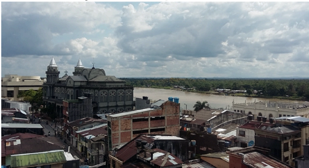
Figura 3. Panorámica de Quibdó desde el norte

Nota: se muestran casas típicas y los principales edificios monumentales (Catedral San Francisco de Asís, Banco de la República y Diócesis).