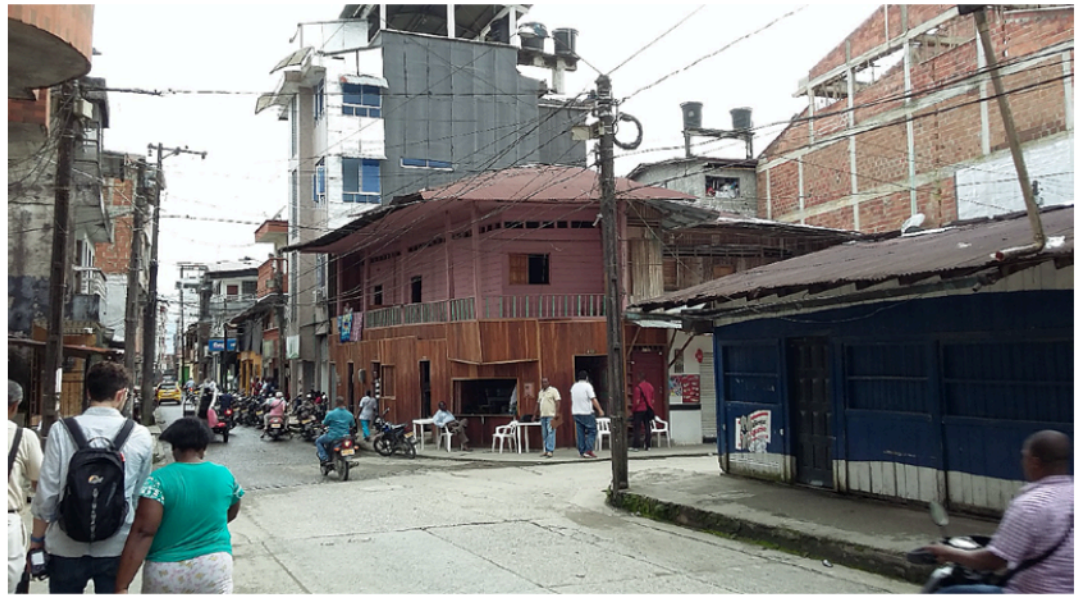
Figura 8. La arquitectura contemporánea de Quibdó

Enmarcar el taller en el debate contemporáneo (figura 2) sobre la importancia del trabajo de campo en los procesos de aprendizaje (France & Haigh, 2018; Dunphy & Spellman, 2009; Fuller et al. , 2006; Scott et al. , 2006), muestra algunos avances adicionales. La asignación de pequeños ejercicios de solución de