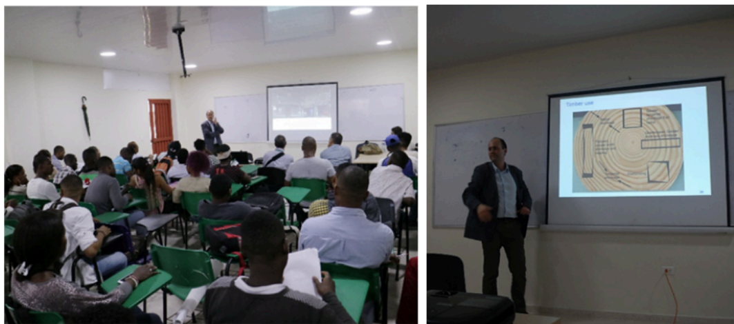
Figura 5. Charla-conferencia durante el primer día del taller

El análisis posterior continuó el cuarto día, los estudiantes comenzaron a preparar sus presentaciones para la revisión. En la tarde, los grupos presentaron sus análisis y propuestas en el auditorio con la ayuda de pósters (figura 7). Los propietarios de las casas estudiadas fueron invitados a la revisión, en especial, la propietaria de Casa Medina, quien generó una discusión muy significativa sobre la importancia de preservar los edificios de madera en