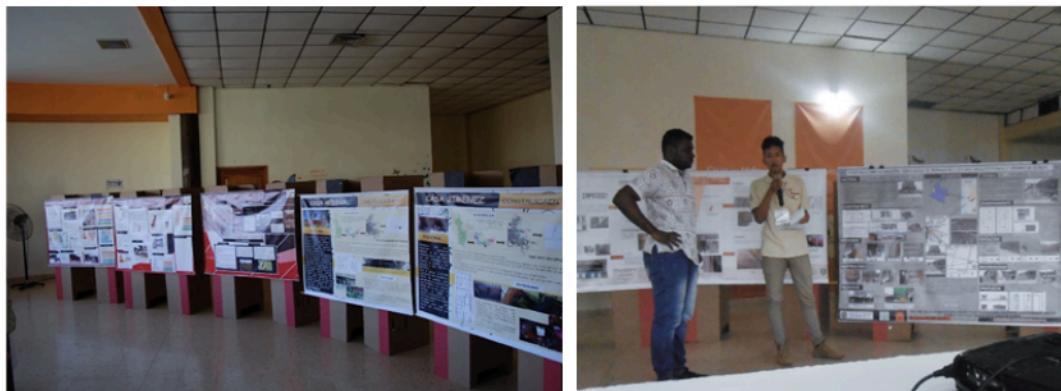
Figura 7. Ejemplos del trabajo de los estudiantes y la exhibición final