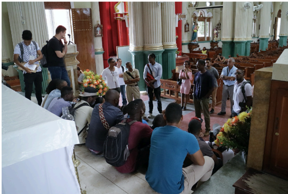
Figura 6. Alumnos durante la visita a la catedral