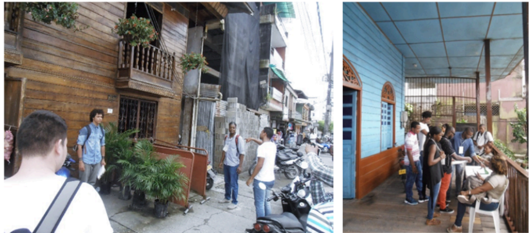
Figura 4. Trabajo de campo en Quibdó

Nota: estudiantes de la UTCH durante el levantamiento arquitectónico de los patrones de composición típicos. Izquierda: la muy bien conservada Casa Copete (Carrera 5 y Calle 27, barrio Cesar Conto). Derecha: Casa Medina (Carrera 7 y Calle 24, barrio La Yescagrande).