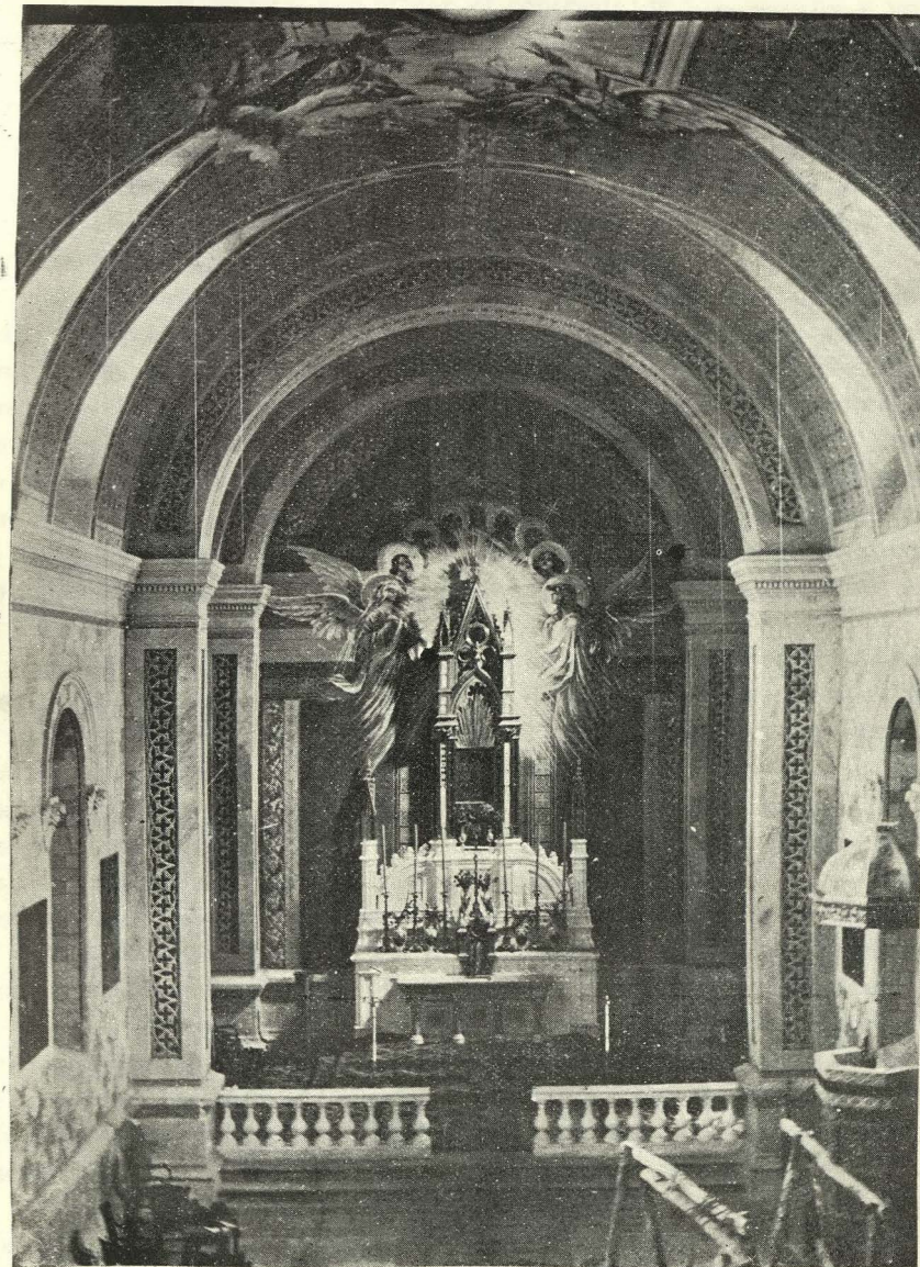
Altar de la Capilla del Rosario

Después de contemplar la portada y de pasar la secular puerta de hojas profusamente claveteadas, con los pesados cerrojos que la exornan, dándole mayor carácter, siente el espíritu una impresión difícil de expresar por el cambio que experimenta la vista de lo an-