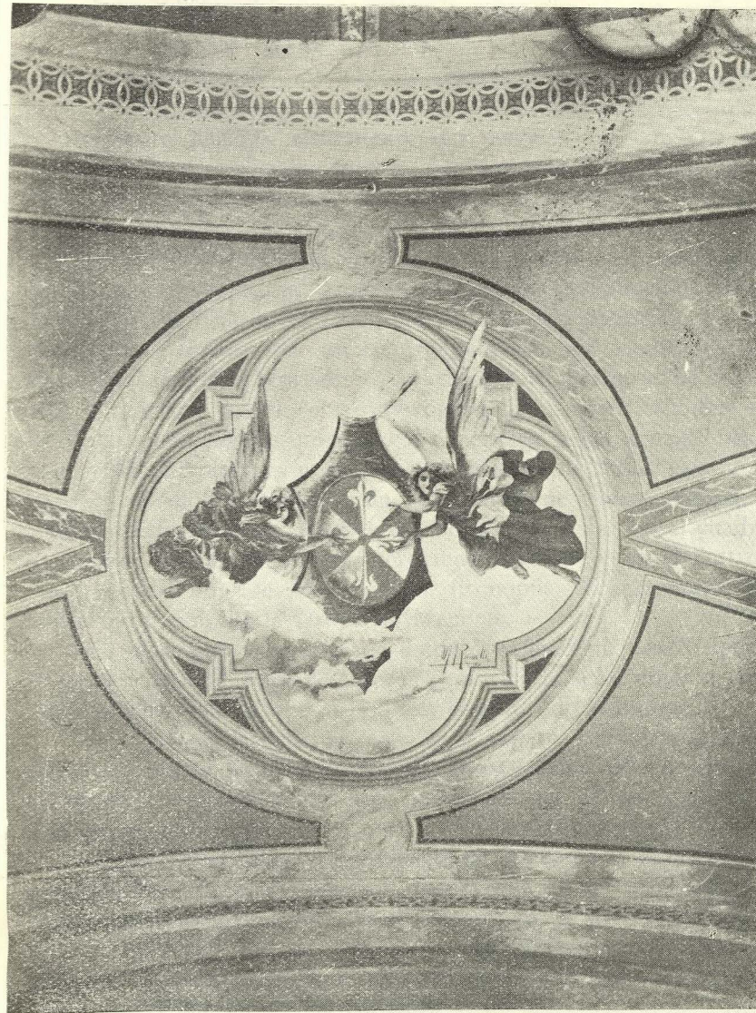
Fresco en la Bóveda del Presbiterio.

Dos filas de ventanas dan entrada a la luz de la capilla: las inferiores son de medio punto, coronadas por una cornisa moldurada que sostiene cabezas de ángeles en lugar de consolas. Los arquitectos modernos han sido inspirados, después del Renacimiento, de las disposiciones generales usadas en los edificios antiguos para la decoración de las ventanas, pero modificándolas en los detalles y añadiéndoles nuevos elementos. Nosotros creemos que todo sistema que tienda a encerrar, para los menores detalles, la arquitectura en fór-