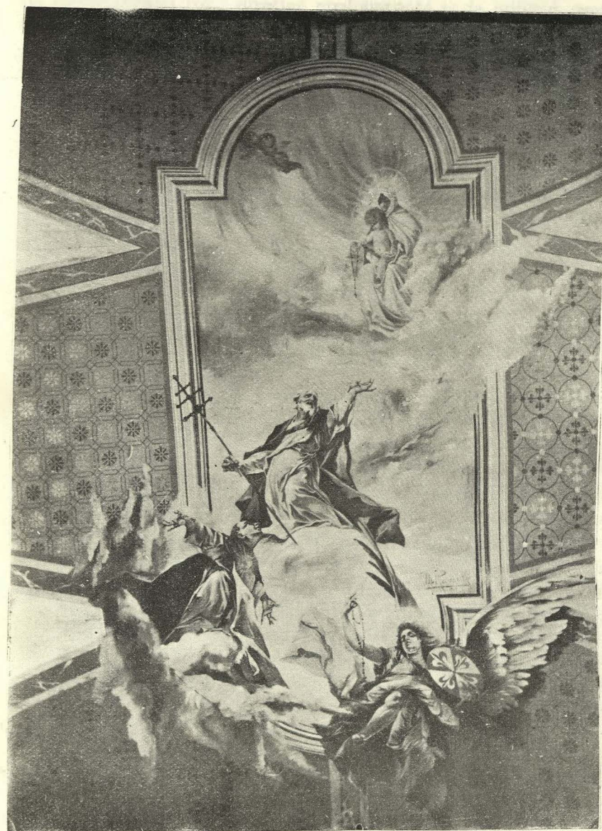
Fresco en la Bóveda Principal