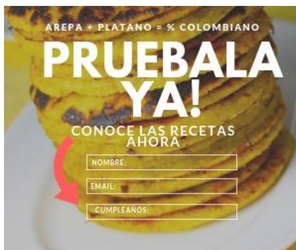
Ilustración 10 Pop-Up de comunidad

Dado que la estrategia para PatiArepa está centrada alrededor del posicionamiento del producto en el mercado el pop-up está enfocado en la captura de datos, los cuales serán usados para poder hacer e-mail marketing más adelante ofreciendo descuentos o promociones. Para tentar a los potenciales consumidores a que dejen sus datos se les ofrecen recetas, las cuales serán enviadas a sus correos.