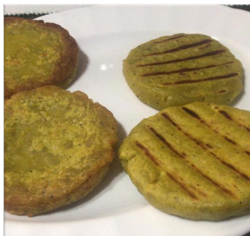
Ilustración 15 Producto