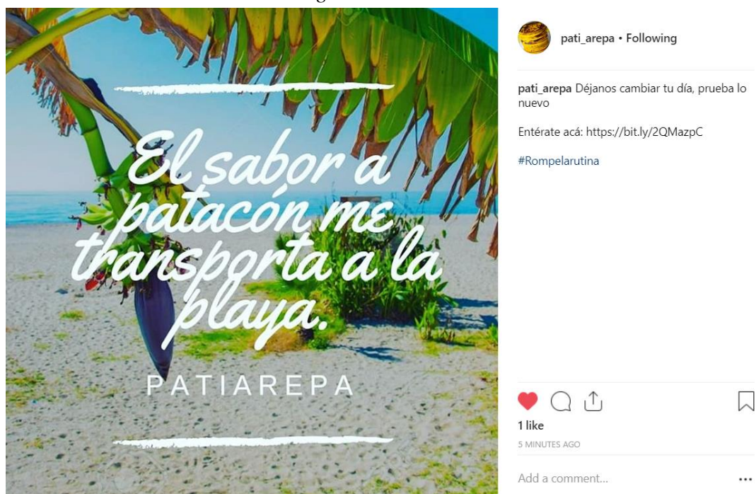
Ilustración 14 Publicidad en Instagram