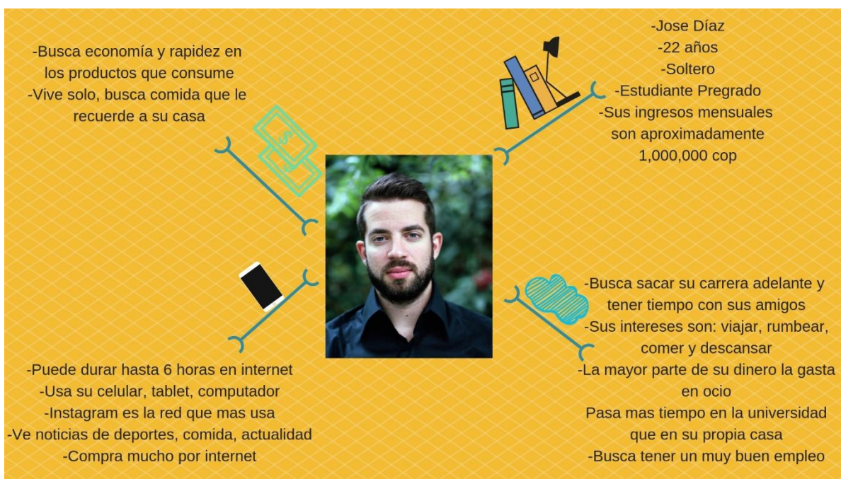
Ilustración 1 Buyer Persona #1

Por último, es una mujer que busca dividir su tiempo entre el trabajo y su familia, sin descuidar ninguno de los anteriores aspectos. Por tal motivo, busca productos que le faciliten la vida, tengan una relación precio – calidad, y pueda asociar con experiencias pasadas. Es por eso, que Pati Arepa es la solución a sus necesidades pues es saludable, económica y contiene uno de los ingredientes más reconocido por todos los colombianos: el plátano.