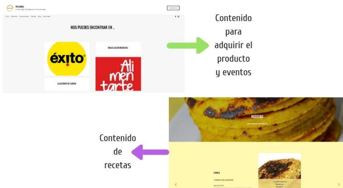
Ilustración 6 Contenido Página Web 2