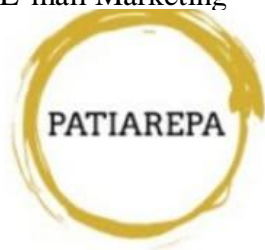
Ilustración 9 Ejemplo E-mail Marketing