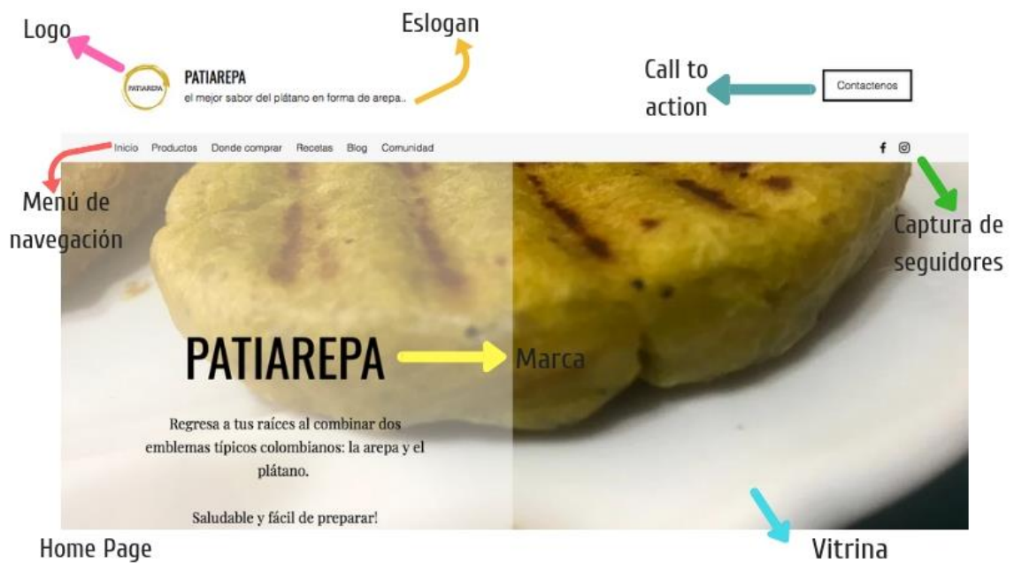
Ilustración 4 Página Web