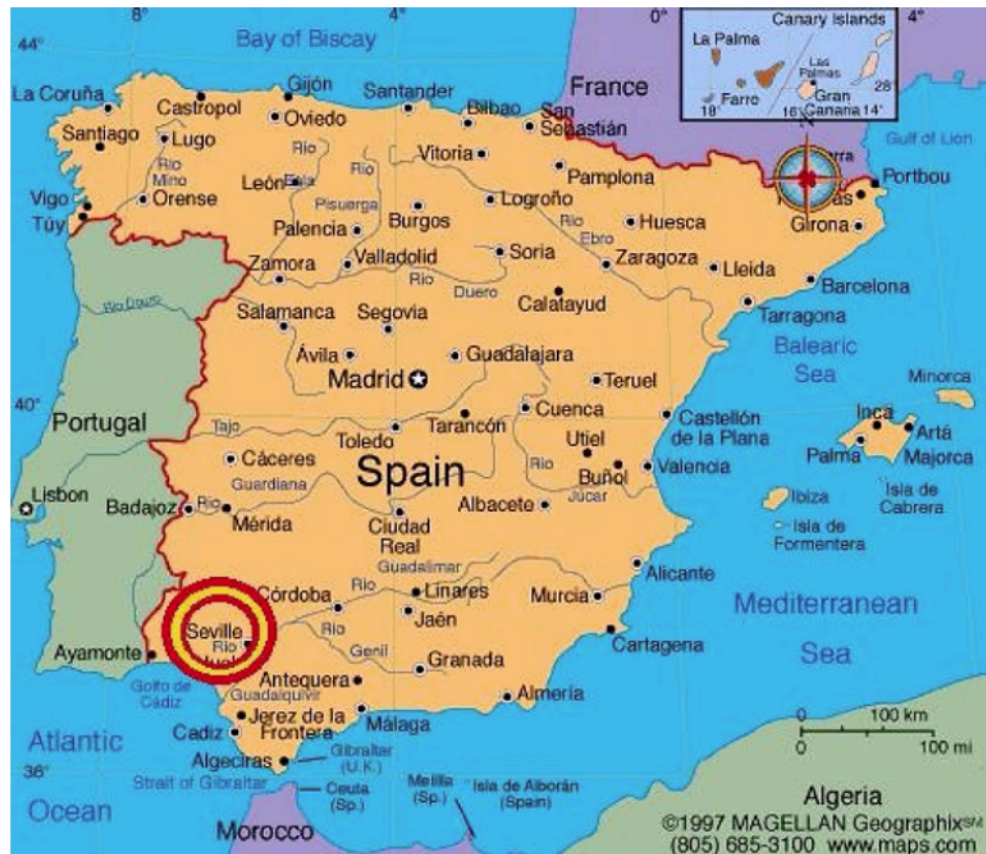
Figura 1. Localização de Sevilla no mapa da Espanha

Trata-se da quarta cidade mais populosa do país, capital da comunidade autônoma da Andalucía, cuja economia é predominantemente terciária, com destaque para o turismo. A agricultura tem papel modesto na economia local. O setor industrial tem participação intermediária, com ênfase do segmento aeronáutico e da aviação civil, cujas exportações agregam valor à economia local. As taxas de desemprego