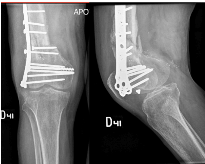
Imagen 2. Seguimiento clínico a 1 año con consolidación de la fractura de fémur distal derecha.

Imagen 1. Paciente de 62 años cursando con no unión recalcitrante de fémur distal derecho. a) Radiografía AP y lateral de rodilla derecha en la que se evidencia deformidad en varo y en recurvatum del fémur distal con falla en la fijación de la placa bloqueada lateral.