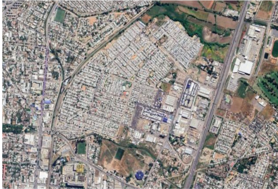
Figura 1. Unidad Vecinal 22 Arturo Prat o Territorio 5