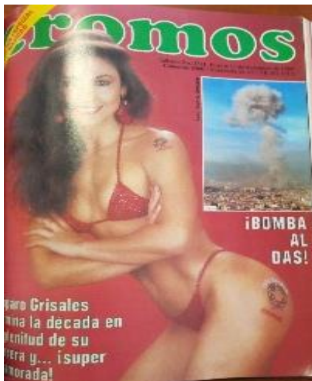
Ilustración 7. Portada de la Revista Cromos , 11 de diciembre de 1989

por el atentado. Por supuesto, esto se puede deber a que la publicación ya tenía preparada portada y contenido, por lo cual la inmediatez del hecho no habría dado espacio a modificaciones; no obstante, es significativo que ni un atentado haya sido capaz de desplazar el interés por una modelo, que no era la primera vez que aparecía en la portada. Al revisar el artículo interior si aparece la tradicional imagen de la fachada semidestruida junto a un pie de nota que dice que “El edificio donde funcionaba el DAS quedó totalmente destruido. El panorama pocos minutos después del atentado se asemeja mucho a las imágenes que presentan países como el Líbano, en guerra desde hace años”. 87