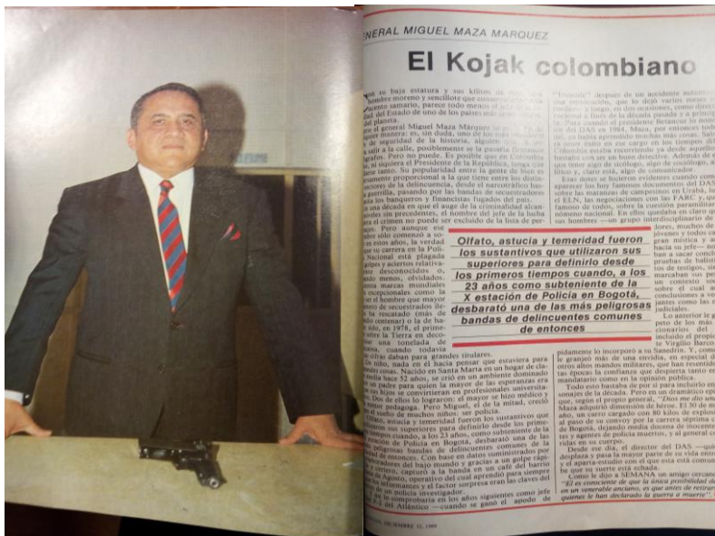
Ilustración 1. En el reportaje de Maza Márquez como uno de los personajes de la década (Revista Semana , 12 de diciembre de 1989) se señala su firmeza hacia los actuantes de los grupos ilegales.

carteles, en especial tras el asesinato del entonces ministro de justicia Rodrigo Lara Bonilla. La reacción por parte del gobierno fue una lucha a diferentes niveles por recuperar la gobernabilidad: desde la legislación se aprobó la extradición a los requeridos por tráfico de narcóticos, desde el aparato judicial se empezaron a dictar órdenes de captura contra los jefes narcotraficantes y desde el ejecutivo, por un lado, se crea un ‘Estatuto para la Defensa de la Democracia’, bajo la figura del Estado de Sitio en enero de 1988, que fue diseñado para proteger a los jueces en su actuar contra el narcotráfico, y por el otro, se designa como director del DAS, en 1984, al coronel de la policía Miguel Maza Márquez, quien en un corto lapso de tiempo se grajearía una fama, al igual que la entidad en general, por sus golpes a las estructuras criminales, así lo evidencia la elección suya como una de las personas más relevantes de la década en el especial de la revista Semana , “10 personajes de los ochenta” del 12 de diciembre de 1989.