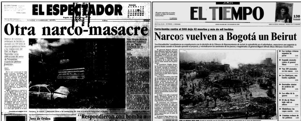
Ilustración 5. Portadas de El Espectador y El Tiempo del día después a los hechos. El Tiempo y El espectador , ediciones del 7 de diciembre de 1989.

Del cubrimiento de los hechos hay que partir del hecho de que los periódicos de la época tomaron partido en el conflicto, compartiendo la denuncia del narcotráfico como un enemigo público; en particular tras el atentado contra El Espectador quedó claro que “la prensa colombiana se unió como un solo actor político y social, dispuesta a organizarse en un frente unido” con un solo objetivo, enfrentar al narcotráfico desde el periodismo”. 85 Así, los diarios de mayor circulación de Colombia le dieron un amplio cubrimiento a la noticia, tanto El Tiempo como El Espectador le dieron la primera plana y un cubrimiento especial al hecho.