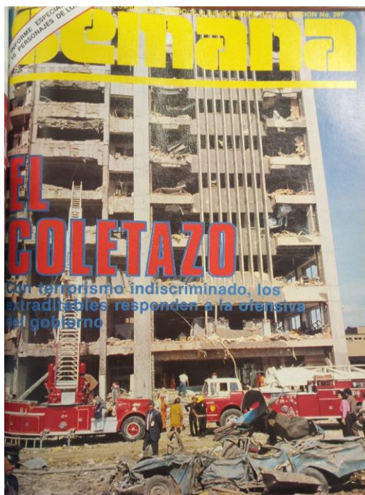
Ilustración 6. Al igual que los diarios de circulación nacional, la portada de la revista Semana muestra la devastación producida por la bomba, aunque en su caso desde el mismo título lo enmarca como una respuesta a las acciones llevadas a cabo por el gobierno nacional. Revista Semana , 12 de diciembre de 1989.

El hecho de que ni siquiera el atentado más grave que se haya sufrido en Colombia, donde hubo 500 heridos y 60 víctimas, haya motivado que el jefe de estado se apersonara de la situación, sino que prefiriera continuar visitando un país lejano, es una evidencia de la insensibilidad ante la violencia en la sociedad colombiana que fue mencionada por los entrevistados anteriormente. Así también lo evidencia el manejo que se le dio a la noticia en la revista Cromos en su edición del 11 de diciembre de 1989.