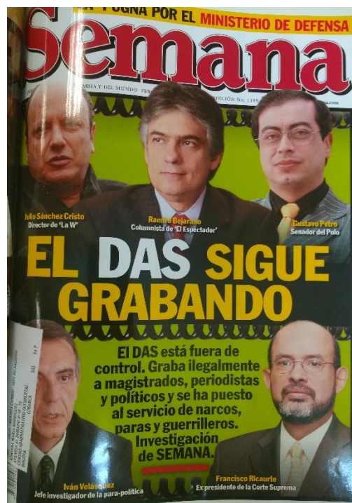
Ilustración 8. Portada de la Revista Semana , 23 de febrero de 2009, donde se denuncia el actuar ilegal realizado por el organismo de inteligencia.

Aun así, con el juzgamiento de Noguera, y tras una nueva reforma 104 , el escándalo sería lentamente superado y la entidad continuaría con sus operaciones.