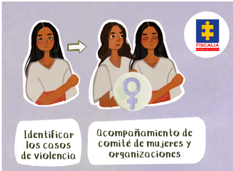
Imagen 5. Grupo de mujeres acompañantes guiados por las Sagas. Proyecto Sembrando esperanzas entre puntadas . Ilustrada por Noah Magé.