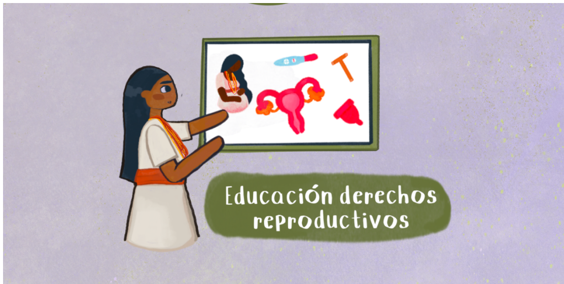
Imagen 3. El acceso a los derechos sexuales y reproductivos. Proyecto Sembrando esperanzas entre puntadas . Ilustrada por Noah Magé.

Esta propuesta surge como una respuesta política y pedagógica que reconoce la necesidad de generar espacios formativos que trasciendan de las concepciones hegemónicas occidentales sobre sexualidad y acceso a derechos reproductivos, para incorporar diálogos con los saberes y prácticas ancestrales presentes en la cosmovisión de las mujeres de pueblo Wiwa. Tal y como lo propuse en el capítulo anterior, las afectaciones que traen las violencias sexuales a los derechos sexuales y reproductivos constituyen un daño intangible en tanto van más allá de las heridas físicas inmediatas y se expresan en procesos subjetivos y emocionales, lo que implica una ruptura profunda en la autonomía corporal, la dignidad y la capacidad de tomar libremente decisiones (Engle, 2022).