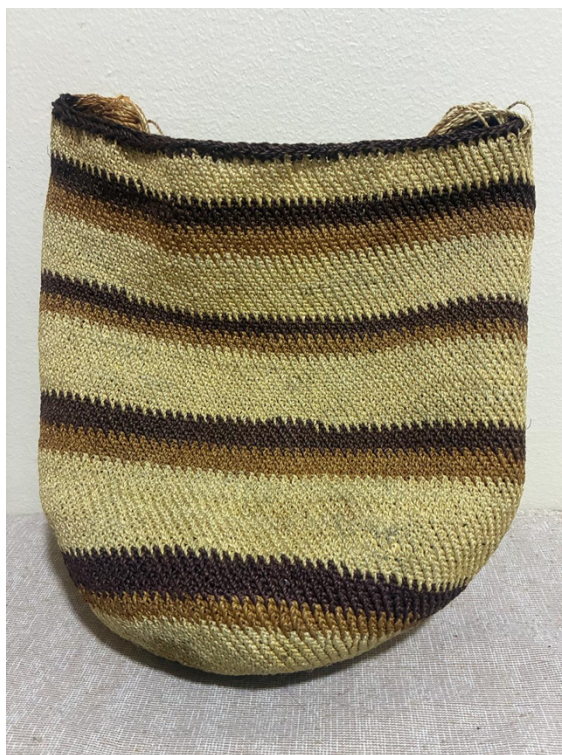
Foto 3. El cuerpo de la mochila, agosto de 2025.