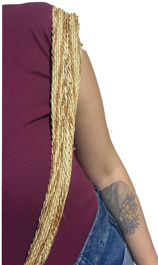
Foto 3. La gaza de la mochila, agosto de 2025.