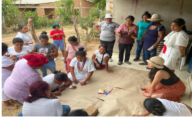
Foto 2. Mi primer encuentro con las mujeres del pueblo wiwa en febrero de 2022.