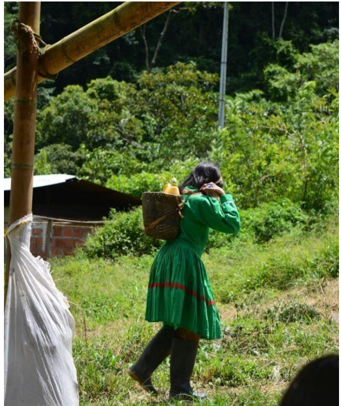
Mujer embera después de recoger la cosecha de yuca.