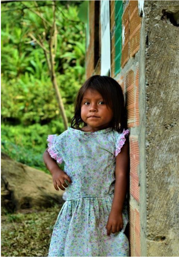
Niña del resguardo Bajo San Juan.

como lo reconocen los indígenas, personifica al ser humano. "Son dos bolitas que nacen del tallo, como senitos que representan lo masculino y lo femenino", afirmó Dayana Domicó mientras recordaba cómo su abuela la había sellado espiritualmente con este fruto.