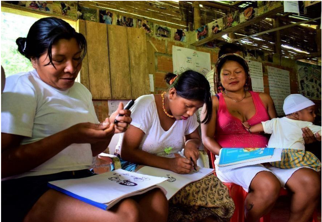
Mujeres emberas durante entrevista grupal en el resguardo de Bajo San Juan.

Entre risas nerviosas, preguntaron cómo mantenían relaciones los que no eran emberas. Cuando escucharon que normalmente se estaba desnudo durante el acto sexual, se miraban unas a otras desconfiadas y se cuestionaban si era en serio. Al saber que las mujeres ajenas a su cultura tampoco tenían ningún corte en la zona íntima de su cuerpo, más seguían indagando.