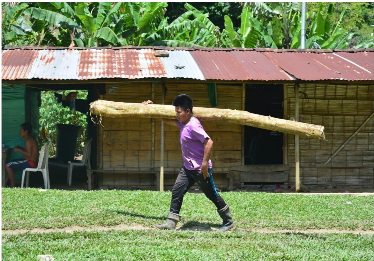
Indígena embera cargando tronco para la construcción de casas en el resguardo de Bajo San Juan.