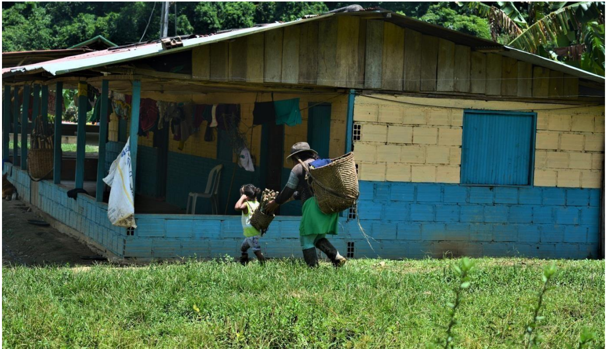
Mujer y niña embera cargando yuca en el resguardo de Bajo San Juan.

Entre la inmensidad de la selva y el ruido del río que baja, entre la siembra y los frutos que con sus manos baraja. Wera es la mujer embera, aquella que nace de las raíces de la tierra y extiende su cultura a través de la enseñanza. Su cuerpo es un territorio de silencio que en el interior esconde marcas que se han perpetuado a lo largo de la historia.