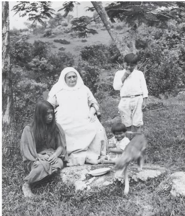
Hermana Laura en misión religiosa con los indios Katíos en el Cuchillón, Medellín, en 1939. Fotografía recuperada del diario de la Santa, publicado por la Fundadora Congregación de Misioneras de María Inmaculada y Santa Catalina de Sena.