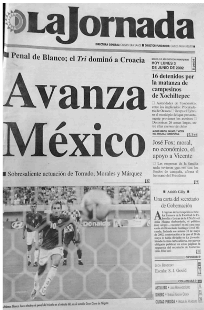
Figura 2. Primera plana del diario “La Jornada” del lunes 03 de junio de 2002

fue su grado de exposición en la agenda, con todo y que, tanto por sus características de orden social y su brutalidad, hacen de este un caso paradigmático. En el proceso de investigación al respecto, se encontró que la fecha del 31 de mayo de 2002 coincide con el inicio de la Copa Mundial de Fútbol de ese año, realizada en los países de Corea del Sur y Japón, evento que acaparó los espacios de noticias electrónicos e impresos durante todo un mes opacando el caso de la muerte de los 27 jornaleros de Xochiltepec e impidiendo la atención de las audiencias del país sobre el mismo (ver figura 2).