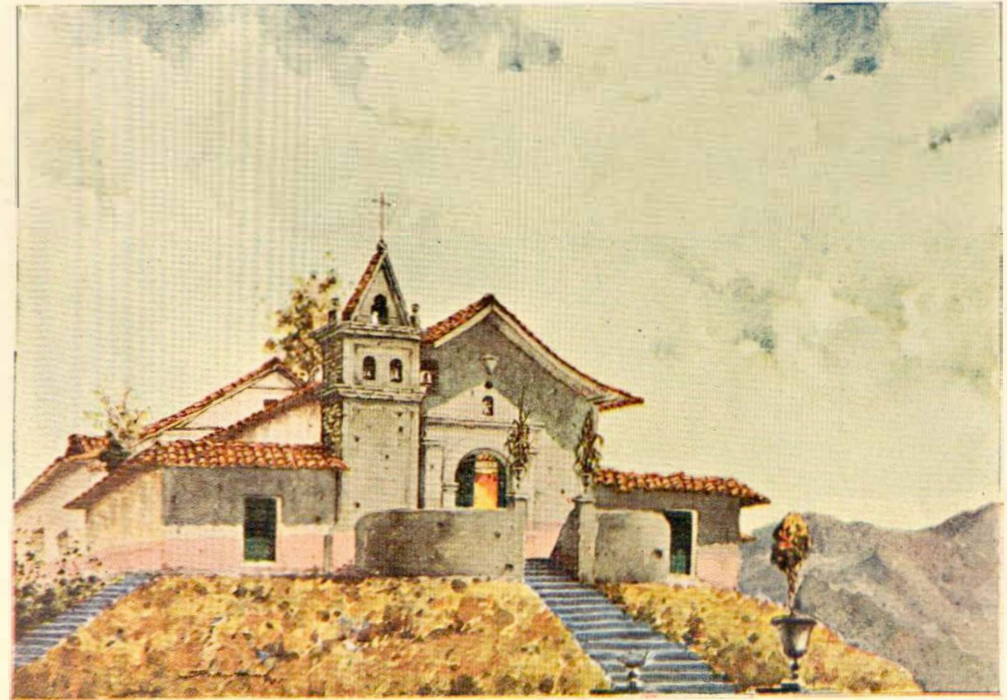
Capilla de San Antonio (Acuarela de Restrepo Rivera)