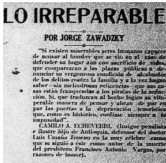
Columna Lo Irreparable escrita por Jorge Zawadzky y publicada por Relator el 29 de diciembre de 1933.

el hombre tenía un rol activo en el que podía defender su honra de forma pública y agresiva 27 .