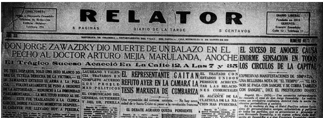
Primera plana del periódico Relator del 23 de agosto de 1933.