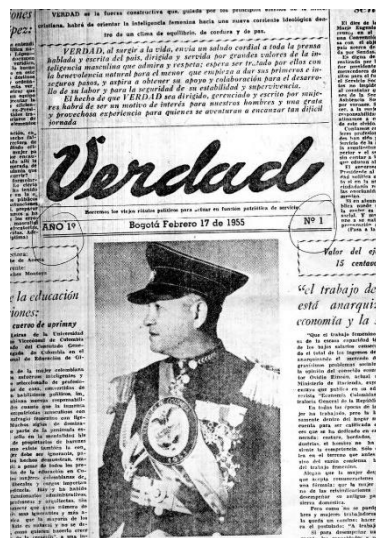
Primera edición del periódico Verdad (1955).

Ofelia Uribe de Acosta fue una sufragista e impulsadora del movimiento feminista en Colombia. Nació el 22 de diciembre de 1900 en Oiba (Santander) en el seno de una familia liberal 25 . Antes de dirigir Verdad , Ofelia ya había participado en otros proyectos revolucionarios como el programa radial La hora feminista y el periódico Agitación Femenina 26 . El periódico Verdad continuaría con el objetivo de instruir a la mujer que tenía Agitación Femenina y mantendría la participación de algunas de sus antiguas impulsoras, aunque tendría un carácter más ponderado que el primero 27 .