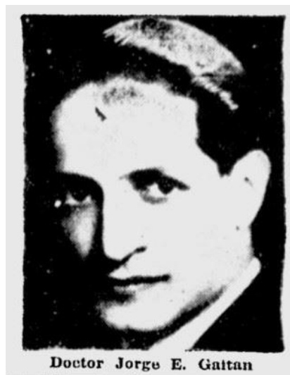
Doctor Jorge E. Gaitán

Para 1933, Jorge Eliecer Gaitán ya era un afamado abogado que, sin embargo, no había llegado a la cúspide de lo que sería su carrera política. En 1929, poco después de haberse posesionado como parlamentario, Gaitán encabezó el debate en el Senado contra el Estado colombiano por la Masacre de las Bananeras acontecida en diciembre de 1928 5 . El abogado denunció el abuso de autoridad del Ejército colombiano y el favor del gobierno a la multinacional United Fruit Company. Postura que benefició, según Gaitán, a la compañía estadounidense mientras sacrificaba los derechos de los empleados y pobladores colombianos que trabajaban allí. A partir de este hecho, el abogado siguió apoyando las causas sindicalistas y participando activamente en la política nacional.