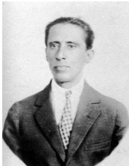
Retrato de Porfirio Barba Jacob

Porfirio Barba Jacob era un hombre generoso e ingenioso que, sin embargo, corría con los bolsillos ligeros. Tenía mala reputación entre los hoteleros por pasar la noche sin tener la intención de pagar y, para el final de sus días, todas sus pertenencias cabían en un maletín 8 . Para el momento de su reencuentro con la familia Zawadzky, la tuberculosis que padecía por más de 10 años se encontraba en una fase avanzada. Jorge se convirtió en un intermediario entre el artista y el Estado colombiano para el envío de fondos que le ayudaran a volver a su país natal o internarse en un hospital 9 . Ninguna de las dos cosas ocurrió finalmente.