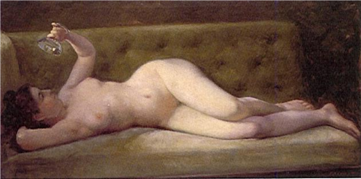
F.A. Cano La última gota Óleo sobre tela 1908 40 x 77 cms. Colección Museo de Antioquia

La primera obra que analizaremos tiene como título La última gota y es una pintura en óleo sobre tela con un tamaño de 40 por 77 centímetros realizada en 1908. Esta obra se compone de un desnudo femenino, se aprecia una mujer de piel blanca y cabello negro recogido que está acostada sobre un sofá con espaldar de color verde oliva; la mujer está boca arriba mientras que sus piernas están ubicadas de medio lado hacia la derecha frente al espectador ocultando sutilmente su sexo. Su mano izquierda, sostiene una copa de cristal volcada hacia abajo la cual observa de manera inexpresiva pero con sumo detenimiento mientras que su brazo derecho lo tiene ubicado en la parte trasera de su cabeza para que la modelo pueda acomodarse mejor. Llama particularmente la atención en este cuadro la iluminación que hay en él ya que la luz se ubica principalmente en el vientre, las caderas y parcialmente en su mano izquierda mientras que en su rostro y pies apenas puede notarse su posición, gesto y color de piel la presente obra.