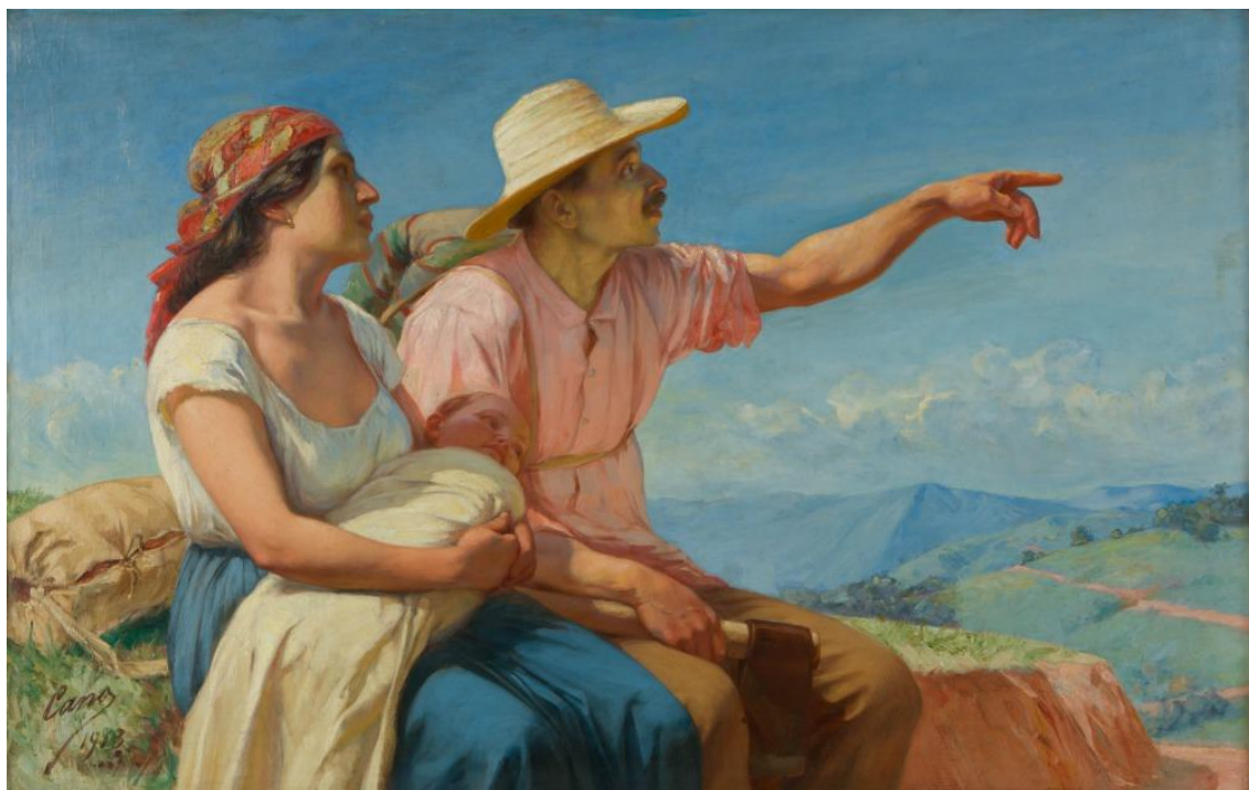
Horizontes Óleo sobre tela 95 x 150 cms. Colección Museo de Antioquia

a aceptar el arte extranjero para nuestros monumentos, y lo peor de todo, obligados a pensar que ser artista aquí es más que en parte alguna, es el peor de los inconvenientes de la vida” 61 . Fuera de esto, Cano continuó realizando pinturas históricas y esculturas conmemorativas por encargo durante su estadía en Bogotá además de pintar algunos óleos de tonos costumbristas y otros ajustados al academicismo, según los dictados de su inspiración 62 .