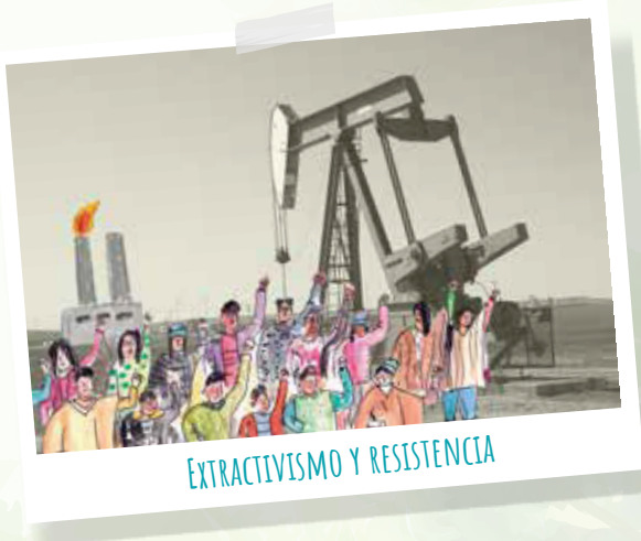
EXTRACTIVISMO Y RESISTENCIA

Algunas prácticas, como el extractivismo forestal, contribuyen en la acumulación concentración de capital, poder y tierras en pocas manos o sectores. Este fenómeno es conocido como acumulación por desposesión y, a su vez, explica cómo la apropiación de recursos públicos y comunales en beneficio de acumulación de capital incurre en despojo y otro tipo de violencias.