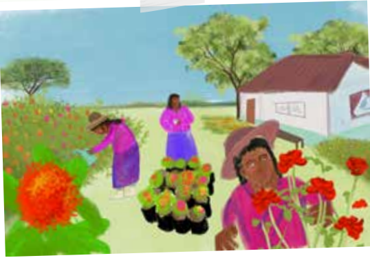
JUSTICIA AMBIENTAL Y POLÍTICAS CULTURALES

Que toda persona pueda disfrutar de un ambiente seguro y saludable constituye un derecho denominado justicia ambiental. Los discursos culturales, ecológicos y económicos movilizan la lucha por la justicia ambiental y, cuando estos chocan entre sí, se produce un conflicto socio ambiental debido al desencuentro entre las políticas culturales, es decir, entre las diferentes concepciones sobre un ambiente saludable, cómo apropiarse de él y cómo reclamarlo.