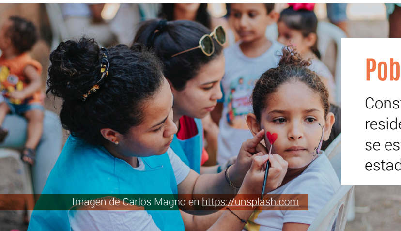
Imagen de Carlos Magno en https://unsplash.com