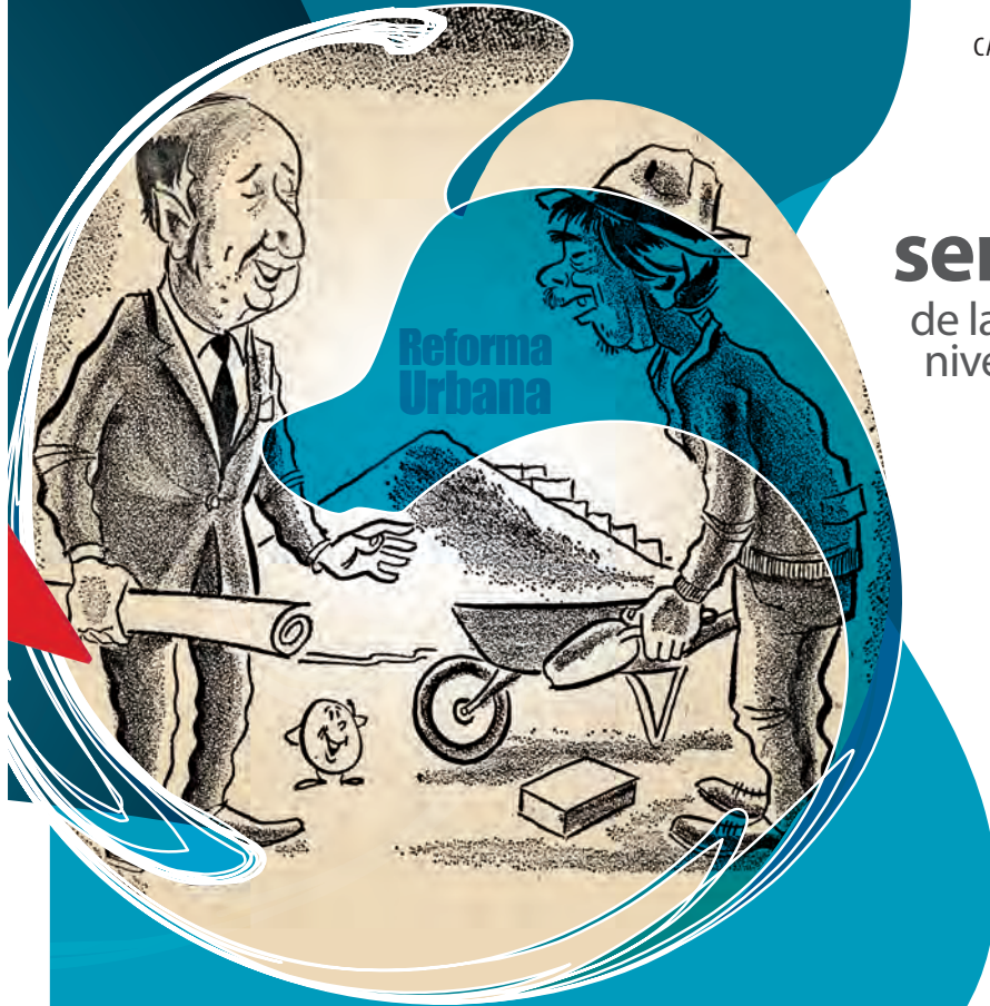
-Así es maestro, esto tiene que tener muy buenos cimientos, para que no se nos vuelvan casas de paja... El Tiempo, 25 de agosto de 1970. Autor: Chapete.

de la historia son la inflación y el bajo nivel de los salarios; la preocupación recurrente es la clase media.