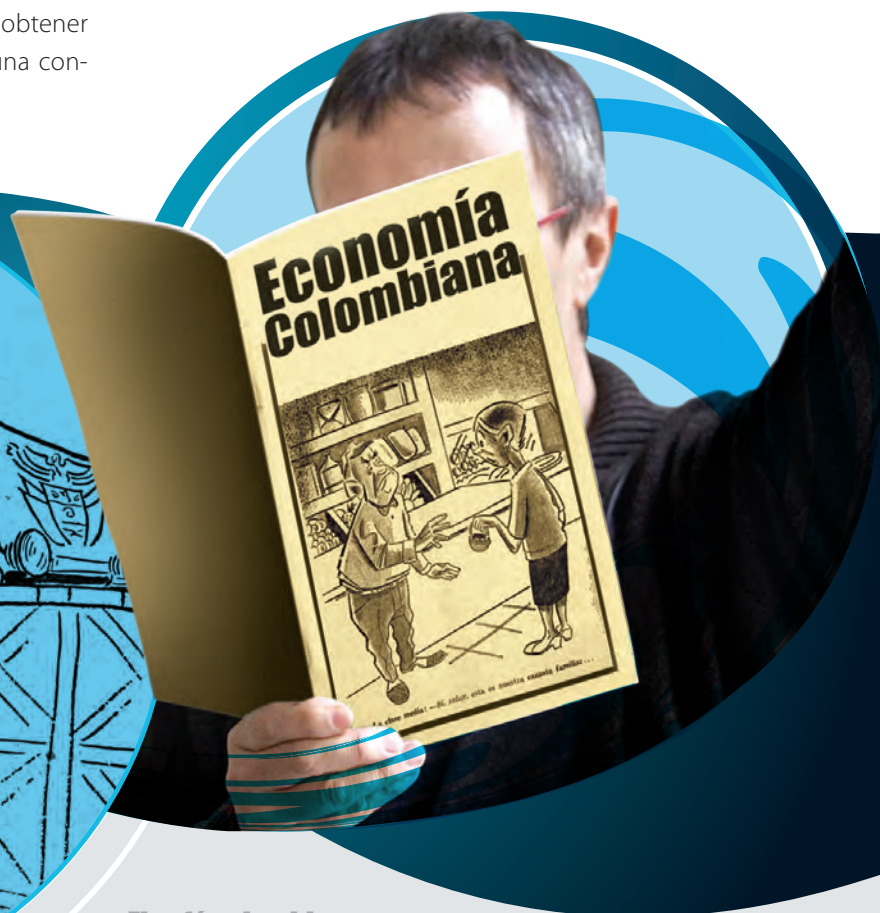
El café colombiano: —Parece que a mi compañero no le agrada la altura—

El Tiempo. 18 de agosto de 1954. Autor: Aldor