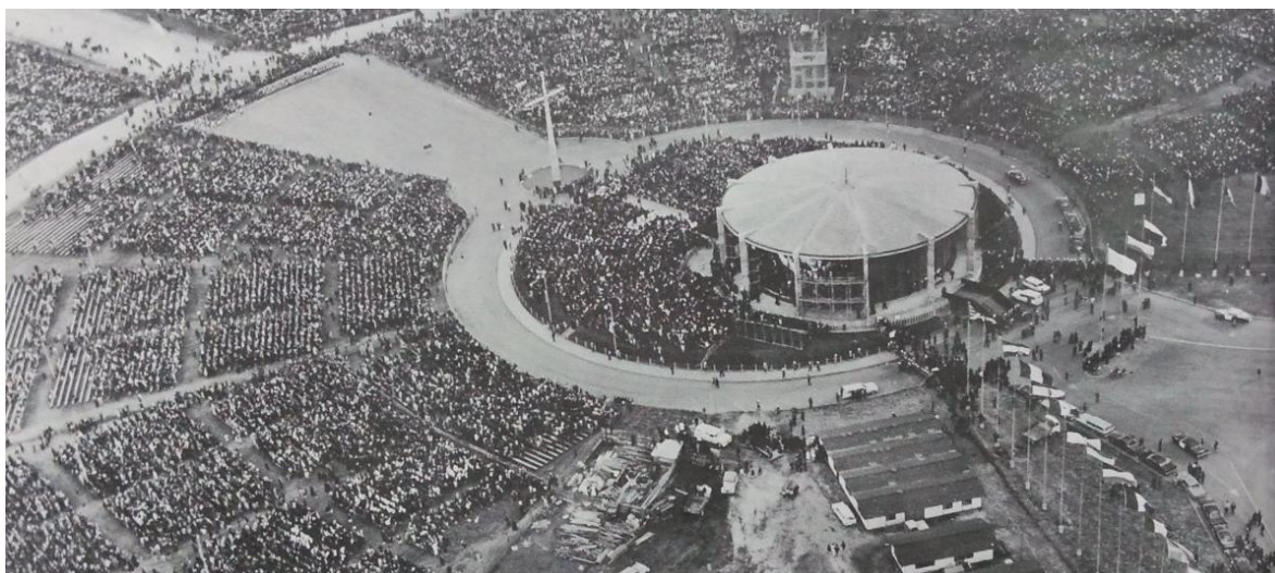
Imagen 2: Visita del Papa Pablo VI al Templo Eucarístico en la ciudad de Bogotá, 1968