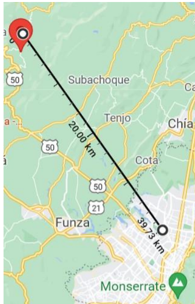
Imagen 1. Ubicación de San Francisco en referencia a Bogotá.

El primer capítulo se desarrolla en torno a dos temáticas. La primera es la discusión del término vinculado . Esta categoría nativa se caracteriza por sus ambigüedades dado a que no hace referencia simplemente a una condición de migrante, sino a lógicas de diferenciación social. Para analizar estas lógicas, tomo el concepto de espacio social de Bourdieu. Según Bourdieu, el espacio social corresponde a un “sistema de separaciones diferenciales en las propiedades de los agentes, es decir, en sus prácticas, en los bienes que ellos poseen” (Bourdieu, 1997, p. 32). La posición y la trayectoria en el espacio social dependen del volumen y de la estructura del capital que poseen las personas (el capital cultural y el capital económico siendo las dos formas de capital más relevantes para entender el funcionamiento de nuestra sociedad) Por una parte, el capital cultural hace referencia al conocimiento legítimo que se ha adquirido desde la niñez, siendo la familia y la escuela las primeras proveedoras . Por otra parte, el capital económico hace referencia a los bienes y recursos económicos que se han adquirido de diferentes maneras (ingresos y patrimonios).