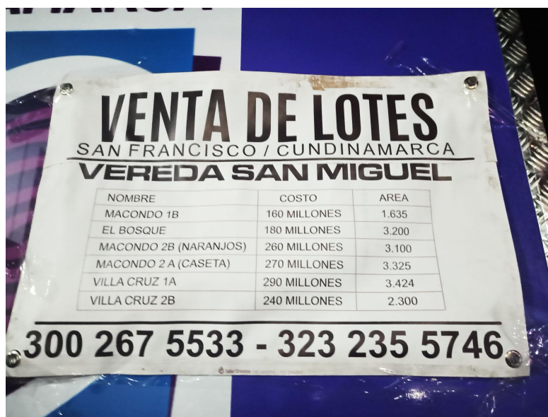
Imagen 4. Pancarta de precios de lotes en venta en San Miguel.

En este capítulo exploré las trayectorias de los principales participantes de esta investigación. Establecí que el ser denominado vinculado da cuenta de las lógicas de diferenciación, basadas en sí es percibido como parte de los locales, más no por ser migrante. El ser vinculado para los integrantes de esta investigación habla de su proceso migratorio, lo que no impide que se sientan parte de los habitantes de San Francisco. Así mismo, resalté que la presencia de estos vinculados trae consigo cambios importantes en el municipio. La llegada de ellos trajo transformaciones en cómo se habita las zonas rurales y los nuevos pobladores que las habitan, lo que trae consigo un desplazamiento de los pobladores locales. Lo más interesante fue entender que los vinculados que hacen parte de esta investigación ven el proceso como pertenecientes al municipio y son susceptible a estos cambios.