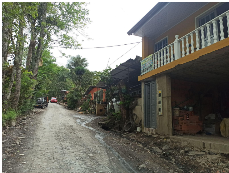
Imagen 3. ‘Asentamientos’ de locales en la vereda Pueblo Viejo.

En segundo lugar, en los fragmentos es posible evidenciar la subida de precios, la forma en que se establecen las veredas “más caras” y la relación que esto tiene con la naturaleza como un capital simbólico. “San Miguel [la vereda] es más caro ahorita porque no hay asentamiento de muchas casas en la carretera principal. Eso se termina viendo feo. En cambio, aquí son fincas más separadas y más privadas. Eso le gusta a las personas” (Fragmento de conversación mayo 2021). Estos “asentamientos” son zonas que están más densamente pobladas, donde viven los locales del municipio. San Miguel es más caro por la ausencia de los locales y de asentamientos que no concuerdan con la estética “natural” que buscan los migrantes.