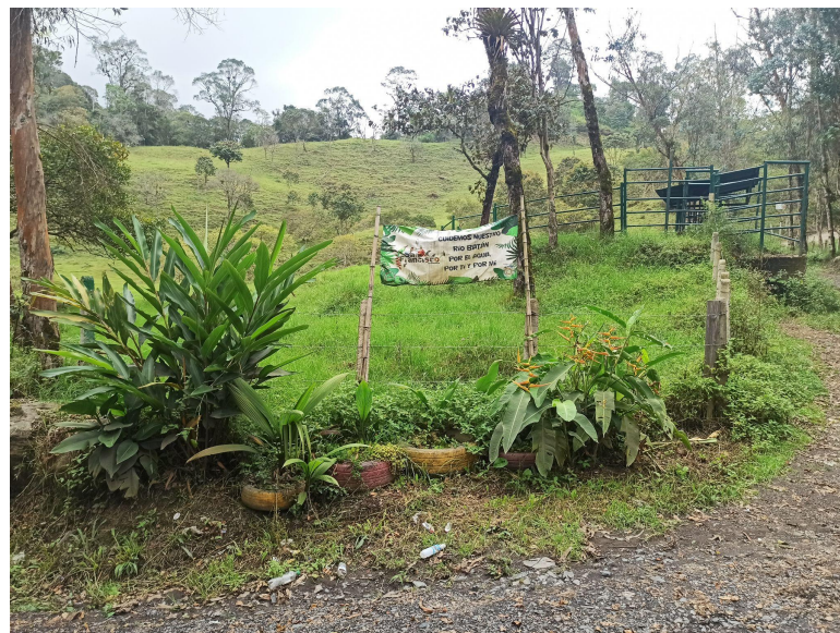
Imagen 6. Señalización y jardinera puesta cerca al río Batán

En el caso de la minga en el río el uso del espacio público está atravesado por el cuidado del medio ambiente. La minga que se realizó en el río Batán giraba en torno al embellecimiento de un espacio con la intención de que dejara de ser un espacio para depositar basura. Los espacios de la minga permiten establecer comportamientos adecuados, que han sido relacionados con una ‘tradición’ indígena de las formas adecuadas del uso de los espacios públicos. Así, la tradición y el cuidado de los recursos naturales se vuelven discursos que justifican el ‘enseñar’ y modificar los comportamientos de los locales.