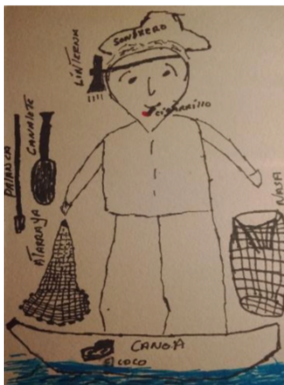
Corpografía no. 1: Aparejos de pesca

En el siguiente dibujo (corpografía no.1) se puede apreciar lo anterior. En este ejercicio se llevó a cabo no solo un mapa del cuerpo, sino también un mapa de las herramientas y de su relación con el cuerpo. En algunos casos, la herramienta tiene una relación más estrecha con solo algunas partes del cuerpo. Se puede ver que algunos aparejos son asignados a ciertas partes del cuerpo porque son un complemento para este. Cuando es así, funcionan como una extensión del cuerpo. Lo que se puede ver aquí es una incorporación de objetos al esquema corporal de los pescadores, como ocurre en el caso del ciego y su bastón (Crossley, 2001).