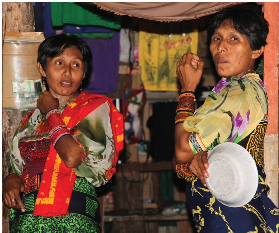
Figura 6. Dos mujeres kunas ataviadas con sendas molas, dueñas de una miscelánea donde venden productos de papelería, vestuario y adornos ‘occidentales’ para la mujer.