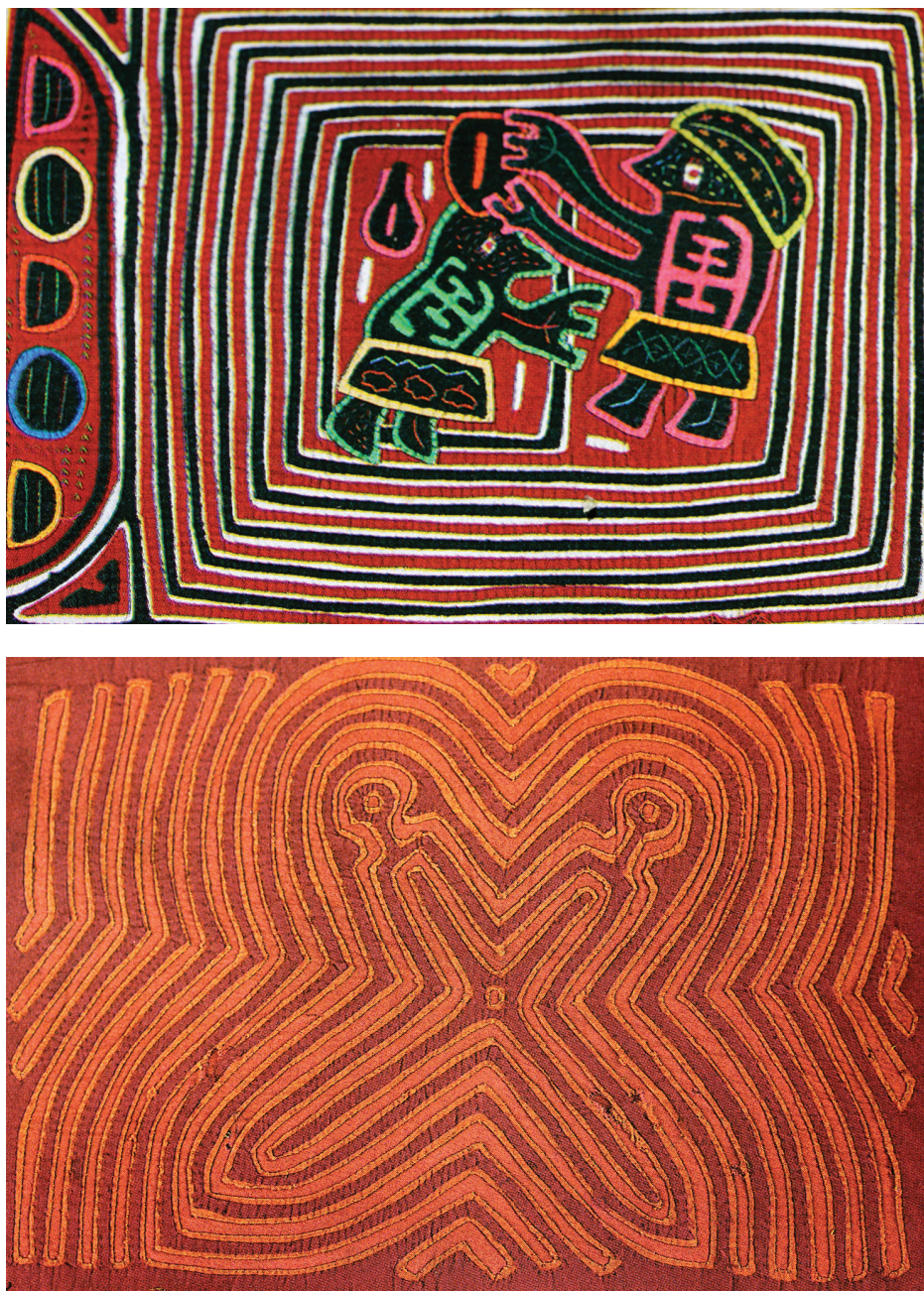
Figura 3. Mola que representa la iniciación del rito de pubertad con una abstracción de la purba (empalizada donde se recluye a la joven) como fondo de la escena, y mola de Tijeras (Tomadas de Perrin: 166 y 172).