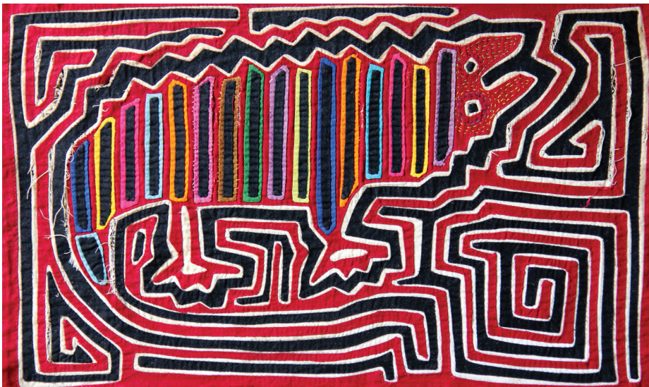
Figura 4. (i) Mola de Madre tierra y (ii) mola de iguana con las capas de la tierra en su interior. En la tradición “se cuenta que todo el armazón de la tierra, el medio que resulta tirando la tierra es puro oro. Las columnas son de oro, los hilos que utilizó Pab para construir, para el sostenimiento de las columnas más fuertes, fueron bejuco de oro. Esa fue la primera capa. Después comienza la segunda capa. Entonces Pab utiliza al oro azul. También en la segunda capa fueron utilizadas todas las flores. Después fue la tercera capa, que fue el oro amarillo. Sucedió todo lo mismo. En la cuarta capa rodeó con el oro rojo” (Green, Relato kuna ).