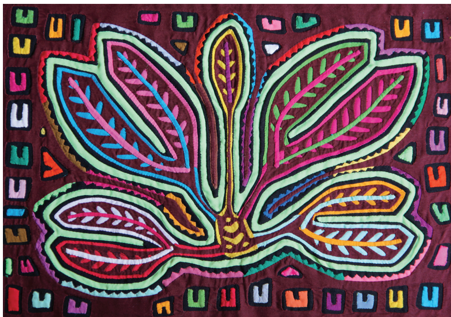
Figura 1. (i) Diseño abstracto de mola hecha con solo dos capas de tela, y (ii) mola de planta sagrada.