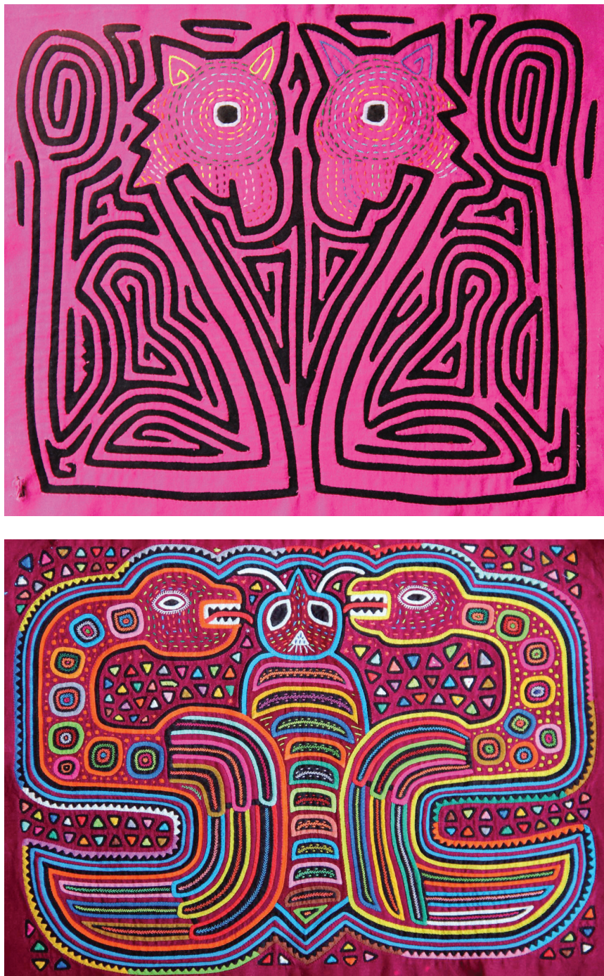
Figura 2. Molas de animales con efectos simétricos, cinéticos y cromáticos que le dan un (i) carácter hierático y (ii) un ambiente cósmico al conjunto.