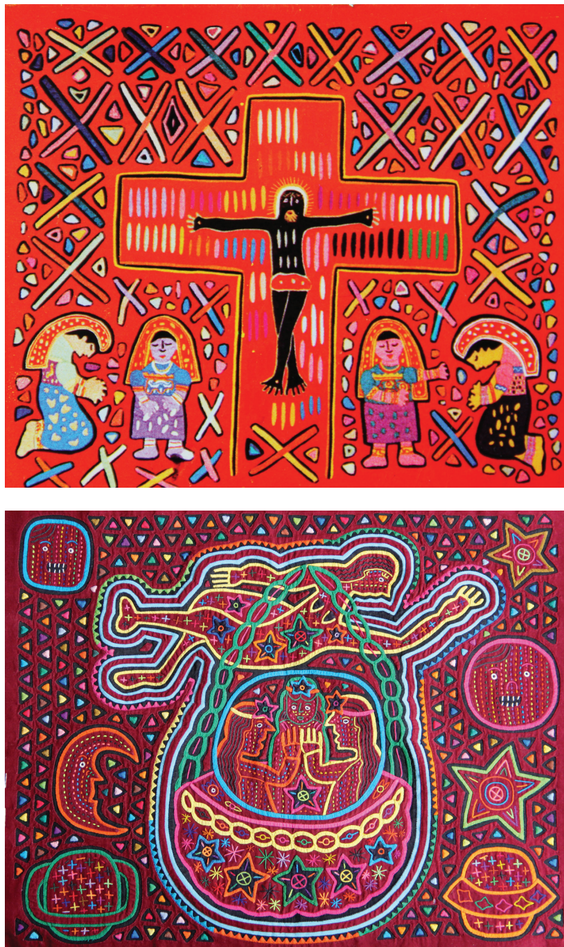
Figura 5. (i) Cristo rodeado de mujeres kunas, y (ii) mola que narra la llegada de las primeras mujeres kunas a la tierra.